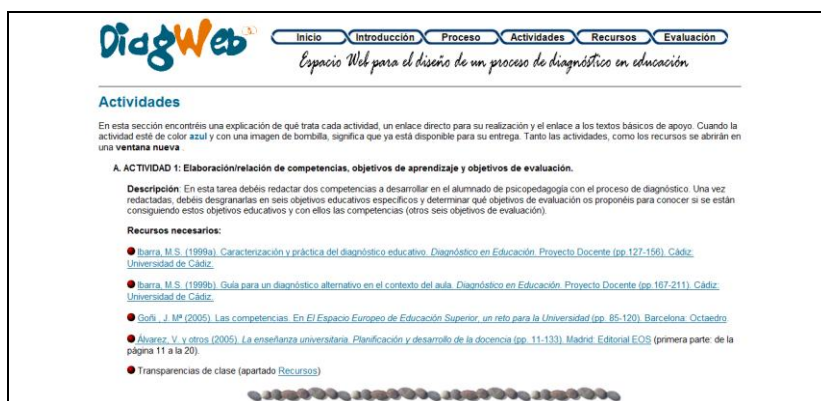
Fig. 4. Apariencia parcial del apartado Actividades de DiagWeb