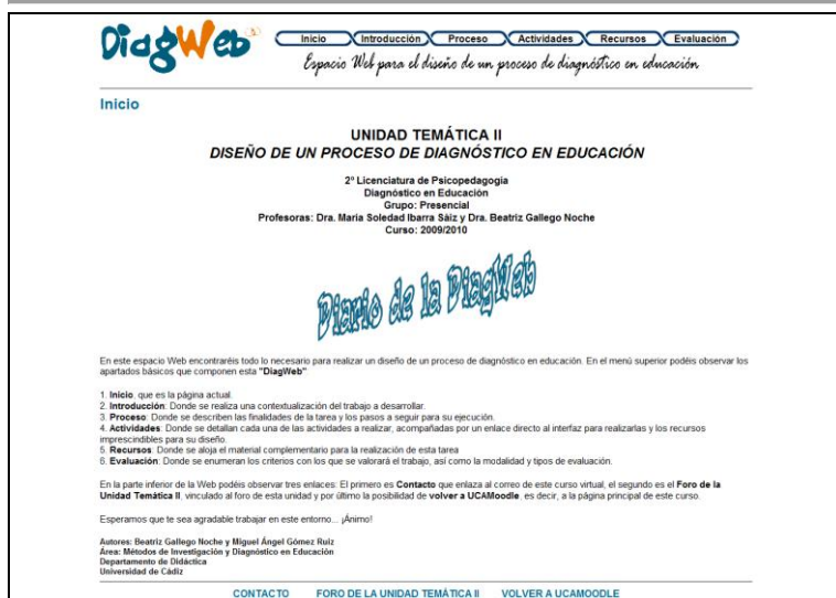
Fig. 1. Apariencia del apartado Inicio de DiagWeb