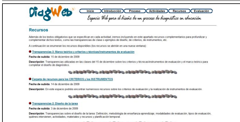
Fig. 5. Apariencia parcial del apartado Recursos de DiagWeb

6. Evaluación: En este último apartado de la DiagWeb, estaban descritos los criterios de evaluación del proyecto, la modalidad y tipo de evaluación y enlazados los instrumentos para las diferentes modalidades de evaluación (autoevaluación, evaluación entre iguales y evaluación del docente) (Figura 6).