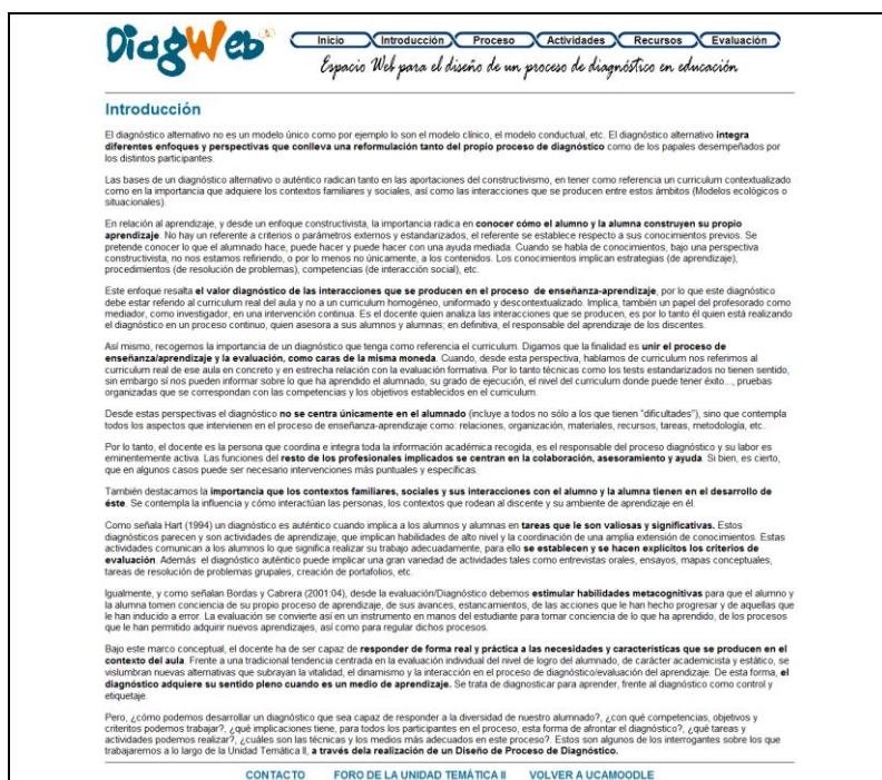
Fig. 2. Apariencia del apartado Introducción de DiagWeb