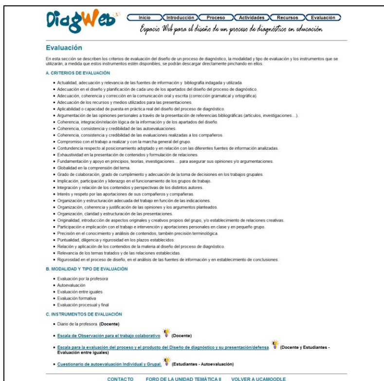
Fig. 6. Apariencia del apartado Evaluación de DiagWeb

6. Evaluación: En este último apartado de la DiagWeb, estaban descritos los criterios de evaluación del proyecto, la modalidad y tipo de evaluación y enlazados los instrumentos para las diferentes modalidades de evaluación (autoevaluación, evaluación entre iguales y evaluación del docente) (Figura 6).