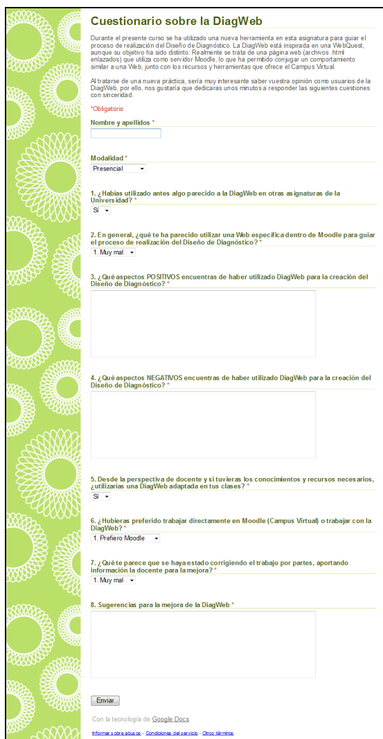
Fig. 7. Cuestionario on-line para los estudiantes sobre DiagWeb