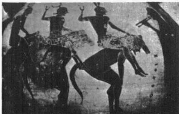
Fig. 2. CORO DE CABALLEROS.

Fuente: L'Atene di Aristofane, Ehrem-breg , Tav. IIb.