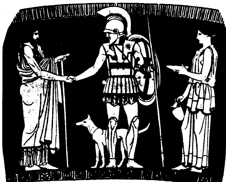
Fig. 1. GUERRERO QUE SE DESPIDE DE SU FAMILIA. (Stamnos del siglo V, British Museum E-448)

Hasta muy recientemente, todo intento por establecer la originalidad de los romanos frente