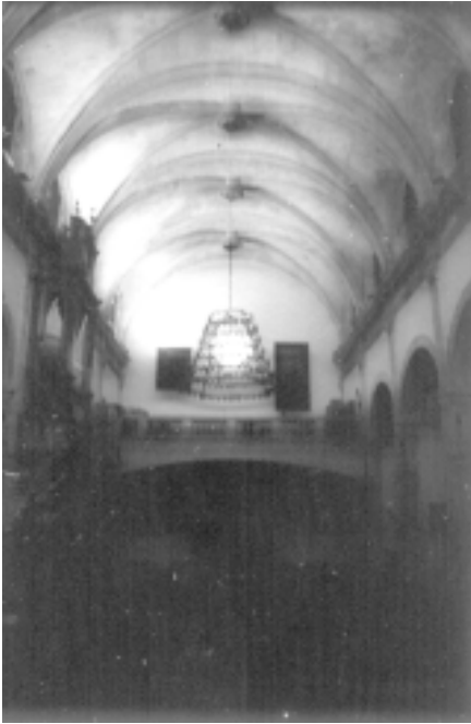
Interior de la nau.

restants, al carrer de Sant Victorià, al carrer de Llorenç Riber i la placeta del Rector Tamorer.