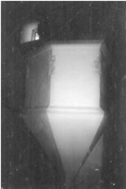
Trona de l'oratori de Sant Miquel.

fins que s'inaugurà el cementiri nou l'any 1927.