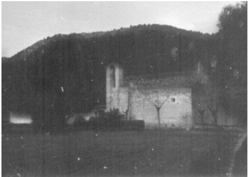
Oratori de Sant Miquel.

papa Innocenci IV. Cap a finals del segle XV va sofrir importants transformacions, les quals li donaren, en gran part, l'aspecte actual.