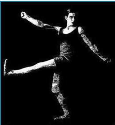
Anton Dolin en Le Train Bleu.