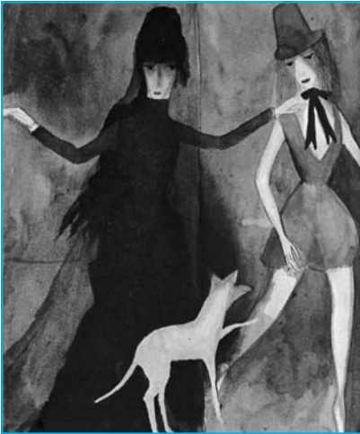
Acuarela de Maria Laurencin para decorado de Les Biches.