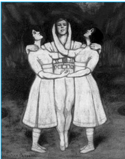
Korsavina, Schollar y Nijinsky en Jeux.

Un personaje importante y fundamental para la música francesa y europea de principios del siglo XX, fue Serge Diaghilev (1872-1929). En 1909 llevó a París el ballet de los Teatros Imperiales de Petersburgo, comenzando así la primera temporada de los Ballets Rusos, que se continuaron en Francia hasta 1929. Eran una inteligente fusión entre la cultura estética francesa y los mitos, los ritmos y las leyendas de la Vieja Rusia, a través de una realización perfectamente cuidadas en todos sus detalles. Diaghilev, que era un extraordinario organizador, renovó totalmente el mundo del ballet, modernizándolo, y supo atraer músicos reconocidos como Igor Stravinsky, Maurice Ravel, Paul Dukas, Erik Satie y Claude Debussy; literatos como Jean Cocteau y pintores como Pablo Picasso, André Derain y Marie Laurencin. El año 1912 encargó a Claude Debussy (1862-1918) la partitura del ballet Jeux – poema danzado , sobre un argumento del bailarín Vaslav Nijinsky. Debussy, que era un excepcional armonizador, un excelente pianista y un orquestador singular, era también un artesano de la creación musical, en el más amplio sentido del concepto. Sus composiciones estaban en las antípodas del post-romanticismo y del wagnerismo, y tuvieron una influencia decisiva sobre la música occidental, tanto clásica como popular, e incluso sobre el jazz.