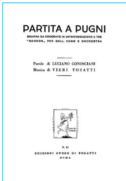
Libreto de Partita a Pugni.

El compositor americano William Schuman (1910-1992) dedicó dos obras a Casey Stingle , estrella del béisbol norteamericano: una ópera en 1953 , The Mighty Casey (El Poderoso Casey) y una cantata en 1976 , Casey at the Bat (Casey al Bate). Vieri Tosatti (1920-), ha desarrollado su actividad de compositor durante los años comprendidos entre 1940 y 1970. Desde hace muchos años vive en su casa de las afueras de Roma, en estado de ceguera, ajeno a cualquier ambiente artístico, sin promover la ejecución de su música. Después de presentar su primera ópera, Il Sistema de la Dolcezza (1951), que atrajo el interés de la crítica, escribió Partita a Pugni (Combate de Boxeo) su trabajo más "famoso". Esta pieza fue compuesta como un drama da concerto in un'introduzione e tres "rounds" per soli, coro e orchestra (concierto dramático con una introducción y tres "rounds" para solistas, coro y orquesta), aunque generalmente ha sido considerada como una ópera. Se estrenó en el Teatro La Fenice de Venecia, el 8 de septiembre de 1953 .