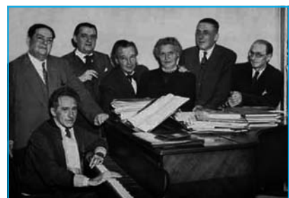
Les Six, hacia 1945. De izquierda a derecha: Milhaud, Auric, Honegger, Tailleferre, Poulenc y Durey; al piano, Cocteau.