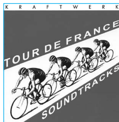
Carátula del CD Tour de France , del grupo Kraftwerk.

Hemos conocido un estudio en el cual se publica una lista de veinte piezas de pop, rock, folk y música electrónica dedicadas a la bicicleta, compuestas entre 1963 y 2003, que si bien creemos que exceden los límites de nuestra investigación, mere-