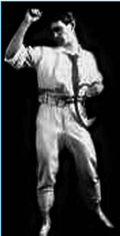
Nijinsky en Jeux.