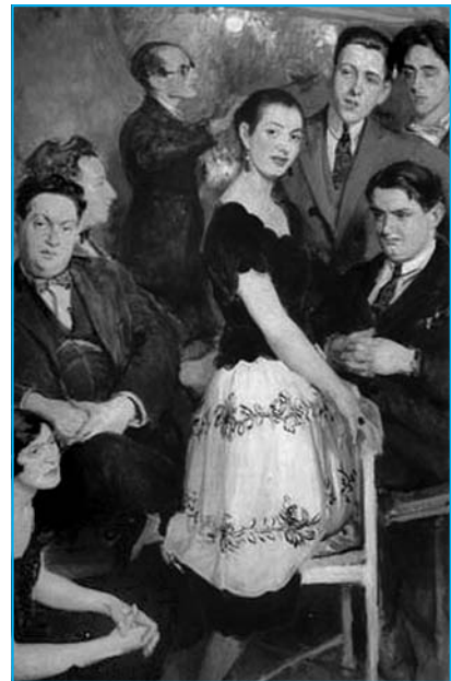
Les Six (pintura de Jacques-Emile Blanche, 1922). En el centro: la pianista Marcelle Meyer. De izquierda a derecha: Tailleferre, Milhaud, Honegger, Durey, Poulenc, Cocteau y Auric.