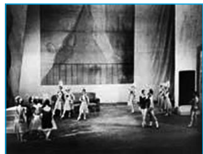
Escena de Les Biches .