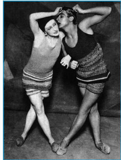
Lidia Sokolova y Anton Dolin en Le Train Bleu.

Argumento: Don Jorge propone a Don Manolito que se case con su sobrina, pero éste considera que es demasiado mayor y quiere seguir soltero. Don Manolito quiere ayudar Margot en sus amoríos con Guillermo, que está enloquecido por el deporte y no le corresponde. Don Manolito adiestra a Guillermo sobre cómo dirigirse a Margot, pero, en este intento, se enamora de la chica. Margot se desilusiona de Guillermo y comienza a enamorarse de Don Manolito. Guillermo continúa con sus deportes y Don Manolito y Margot acaban casándose.