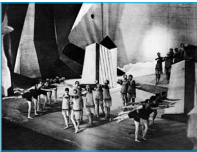
Escena de Le Train Bleu.