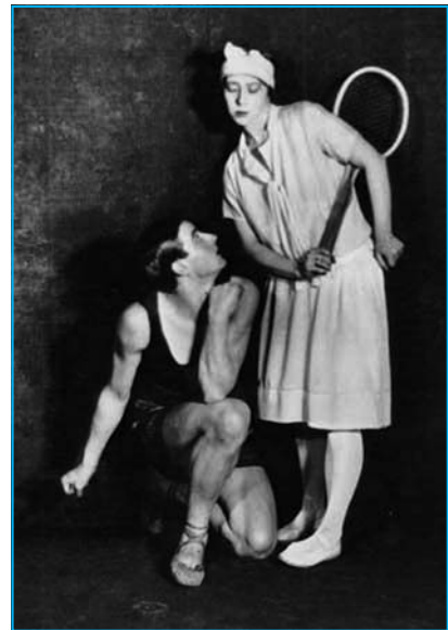
Bronislava Nijinska y Anton Dolin en Le Train Bleu.