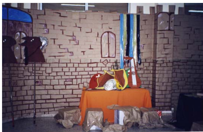
Tercer ciclo EPO- Andalucía en la época de los Descubrimientos (Andalucía y América)