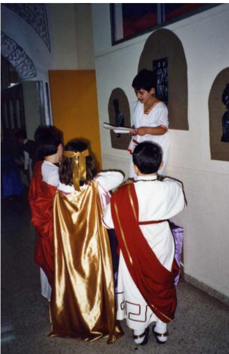
Primer ciclo EPO- Andalucía en los tiempos de griegos y romanos