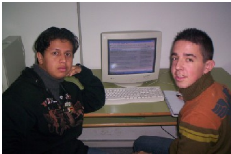
Dos alumnos de nuestro centro buscando información en Internet

Muchos de ellos recibieron correos de bienvenida una vez que los alumnos del hermanamiento vieron las webs, lo que motivó aún más el aprendizaje de inglés al mismo tiempo que iban descubriendo otras cultural de manera tremendamente natural.