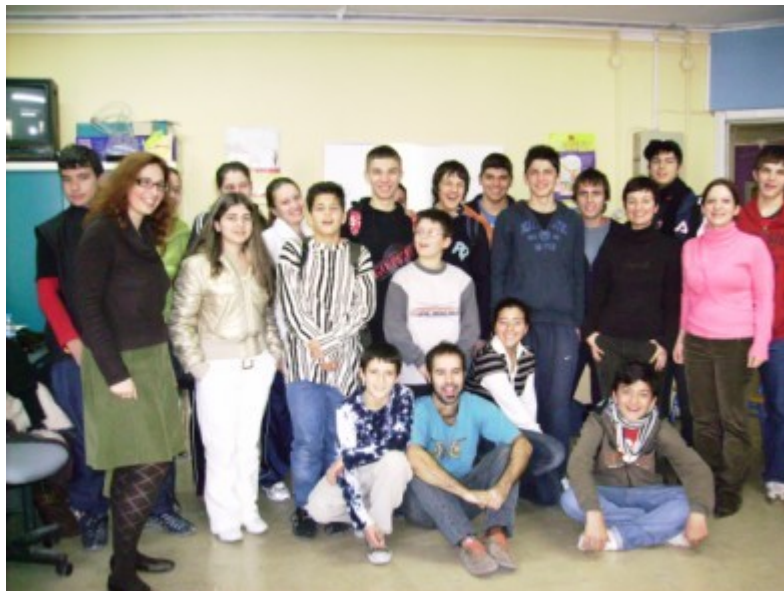
Alumnos y alumnas del centro griego hermanado.