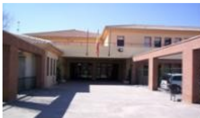
Entrada del IES Américo Castro

Huétor Tájar, localidad donde se ubica el IES “Américo Castro”, se encuentra situada a unos 43 Km. al oeste de Granada y está bien comunicada a través de la autovía A-92. Cuenta con una población cercana a los 9.000 habitantes que mayoritariamente se agrupan en el núcleo urbano (7.000 hab.). Su tasa de crecimiento natural (0,6) es superior a la de otros pueblos de la comarca. El nivel de estudios de la población es básico, con ciertas carencias. Hay pocos titulados medios y superiores.