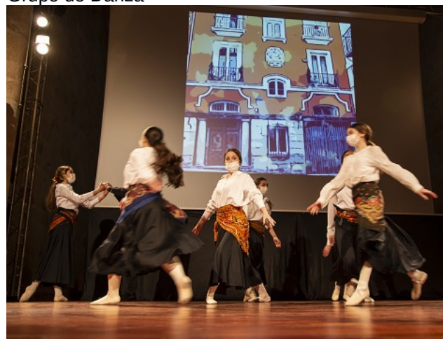
Grupo de Danza