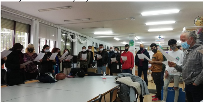
Ensayo del Coro. Bajos y contraltos