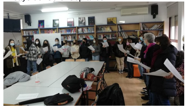
Ensayo del Coro. Sopranos