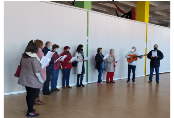
En este ensayo participaron diez personas: ocho entre abuelos y abuelas, y dos tías.