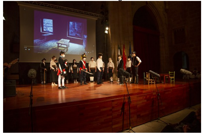
3er ACTO. La Gloriosa. Escenografía