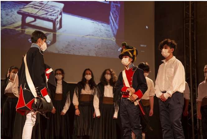
3er ACTO. La revolución Septembrina