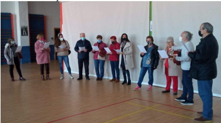
Uno de los ensayos con las familias del alumnado. Gimnasio