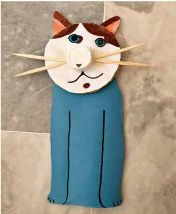
Imagen: Ejemplo de actividad del programa

dirigidas a desarrollar el pensamiento divergente y la creatividad (verbal, matemática, gráfica...). Además, se trabajan también las habilidades socioemocionales, dadas las dificultades que muchos de nuestros alumnos presentan en este ámbito.