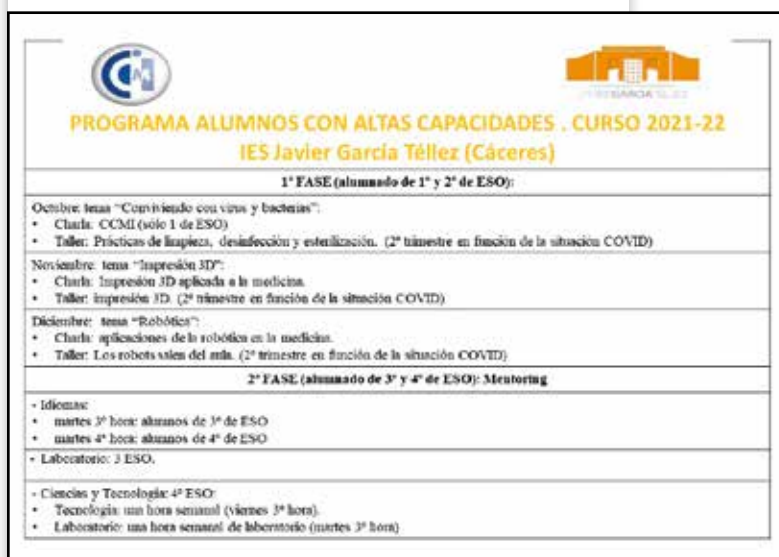
Imagen: Curso 2021/2022

Las escuelas deben crear entornos de aprendizaje en los que los conocimientos que tienen los alumnos sean vistos como un punto de apoyo para la creación de nuevos aprendizajes (Renzulli y Reis, 2016) donde se atienda también al alumnado con AACC, ya que “cuando nos tomamos en serio la educación de los más capaces, mejoramos la educación de todos” (Tourón, 2016, pág.10).