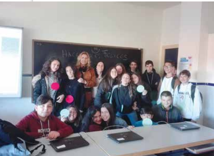
Imagen: Alumnos participantes en el proyecto.