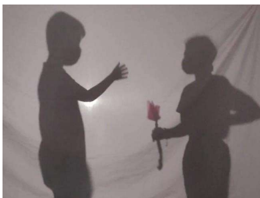
5º de Primaria representando su leyenda a través de un teatro de sombras.

A mí también me encantó la idea de escenificar, así que propuse la actividad en clase y mi alumnado se decantó por dos leyendas: Guayota el maligno y La Muerte de Doramas . Establecieron dos grupos e investigaron haciendo uso de las tablets. Tras recabar la información necesaria, convirtieron la misma en un texto teatral, ¡con sus acotaciones y todo! Fue genial, porque pude conectar perfectamente los aprendizajes dado que estábamos trabajando la estructura textual en clase.