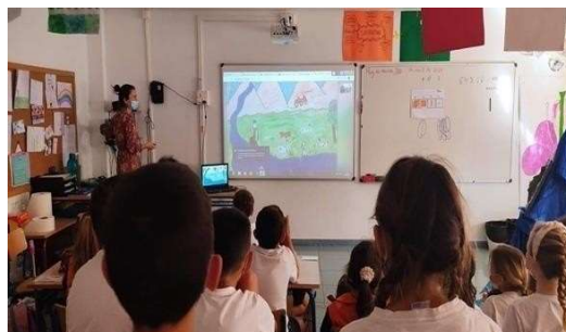
3º de Primaria mostrando los dibujos elaborados por ellos mismos para ilustrar la leyenda trabajada.