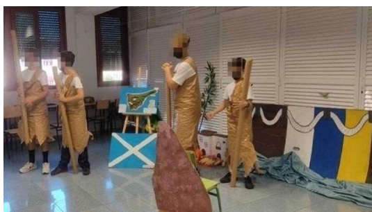
6º de Primaria representando su leyenda a través de una dramatización.