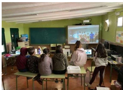
Alumnado de Extremadura disfrutando de la dramatización realizada por 6º A.