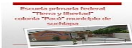
Figura 1. Escuela primaria “Tierra y Libertad”, ubicada en Suchiapa, Chiapas