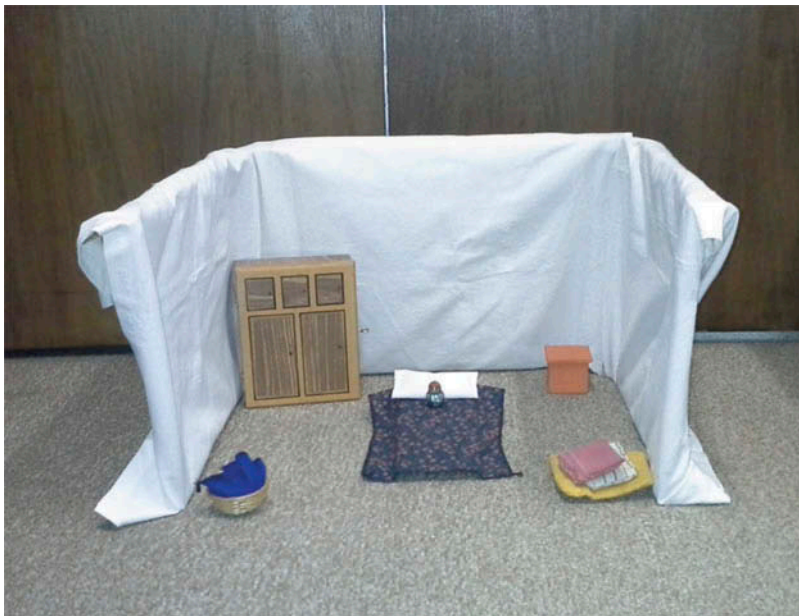
Figura 1. Fotografía de la maqueta.

Construimos una habitación pequeña (1 metro de alto \times 80 cm de profundidad \times 1.20 m de ancho) y su maqueta de aproximadamente la mitad del tamaño (50 \times 40 \times 60 cm), ambas amuebladas como un dormitorio. Maqueta y habitación (símbolo y referente) eran muy similares, excepto por su tamaño (escala 1:2), constituyendo la maqueta una réplica de la habitación. Cada una contaba con una cama, un armario, una caja, un canasto, y almohadones, estos muebles servían como escondites (Figura 1). Maqueta y habitación fueron construidas con telas sostenidas por un armazón con el frente abierto de tal forma que sus contenidos pudieran ser vistos por el niño; ambas se ubicaron en la misma orientación. Un tabique divisorio se colocó entre la habitación y su maqueta con el propósito de que el niño no pudiese observar las dos simultáneamente. También utilizamos dos muñecas de distinto tamaño; a la más grande la escondíamos en la habitación y a la más pequeña, en la maqueta.