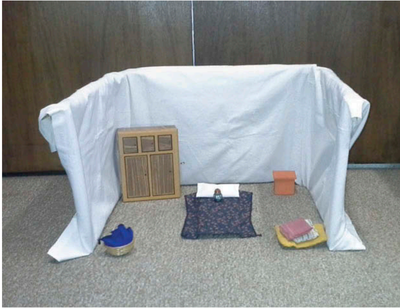
Figure 1. Photograph of the scale model.