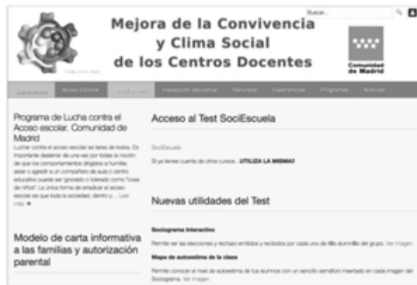
Figura 4. Página web del Test SociEscuela .