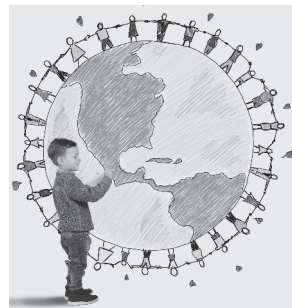
Tabla 6. Mural y debate sobre “La guerra de los botones”