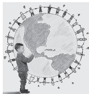
Tabla 10: ¡Nos vamos de excursión!