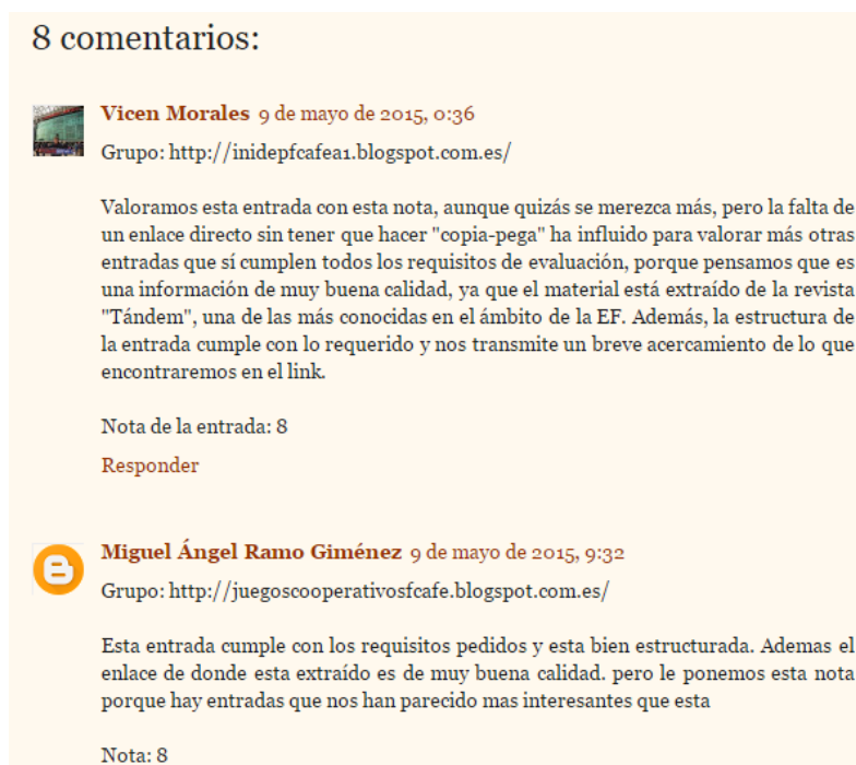
Figura 2. Ejemplo de evaluación de uno de los recursos digitales alojados en uno de los blogs temáticos. (Fuente: Blog de juegos modificados de blanco y diana. Grupo de alumnos de la asignatura. https://goo.gl/DTRmEb ).

Una vez que todos los grupos evaluaron cuantitativa y cualitativamente cada uno de los recursos digitales, se realizó un volcado de la información que permitió tener un ranking de los mejores recursos digitales de cada contenido clave de la asignatura. Además, con esa información se creó un material curricular interactivo que contiene los diez mejores recursos de cada contenido ( https://goo.gl/maQ7T2 ).