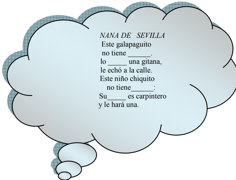
Dibujo con contenido de texto poético: Nana de Sevilla.

En grupos, completad los espacios vacíos del poema con una o varias palabras, según creáis más conveniente. A continuación, intercambiad la hoja con el grupo de al lado y jugad con los miembros de vuestro grupo al teléfono descacharrado, apuntando en el cuaderno lo que el último entienda.