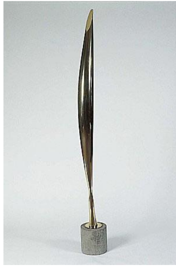
Constanti BRANCUSI Rumanía