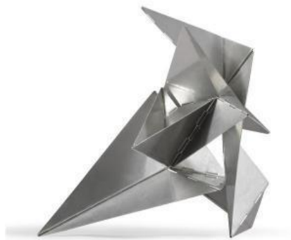
LYGIA Clark Brasil

En las unidades en las que se trabaje con la forma se enseñara al alumnado unos principios básicos de escultura, de soportes y técnicas. Algunos de los referentes serán: