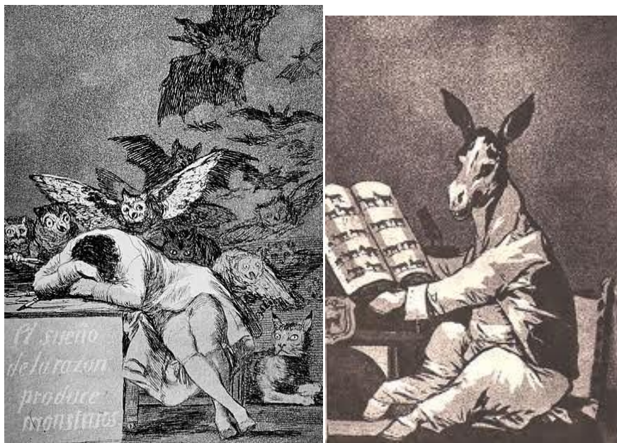
Francisco de GOYA España

En las unidades en las que las alumnas y alumnos realicen dibujo del natural aprenderán conceptos referidos a la luz como claroscuro. En la sesión expositiva el claroscuro irá referenciado con los siguientes artistas: