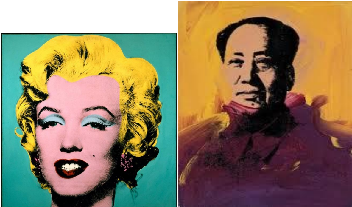
Andy WARHOL Estados Unidos

En la Unidades Didácticas referentes al color, los alumnos y alumnas realizarán varios ejercicios en los que previamente habrán conocido (entre otros), tratándose de color y de retrato se les mostrarán, entre otros, las siguientes obras y autores: