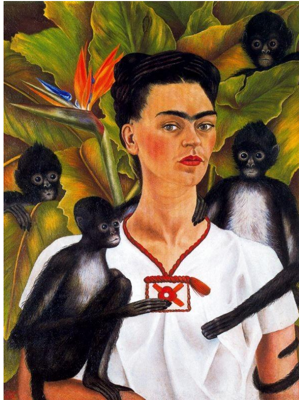
FRIDA Kahlo Méjico