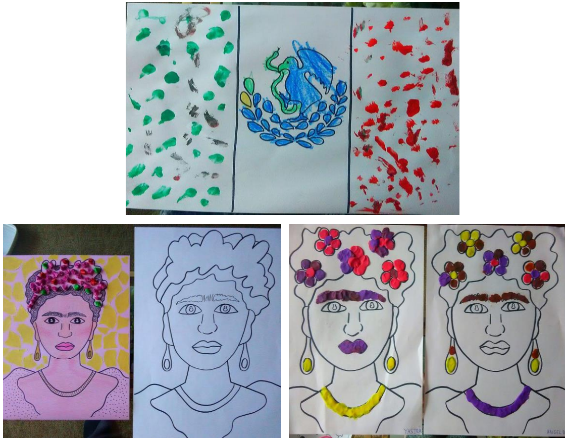
Imágenes de algunas de las manualidades realizadas para el primer destino.

En la quinta sesión realización de un retrato de Frida Kahlo. Damos un retrato de la pintora a los niños, los niños deben hacer bolitas con plastilina, y aplastarlas y pegarlas sobre el retrato, en las flores, el collar, pendientes, etc.