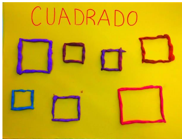
Imágenes de algunas de las actividades realizadas en el cuento 2.