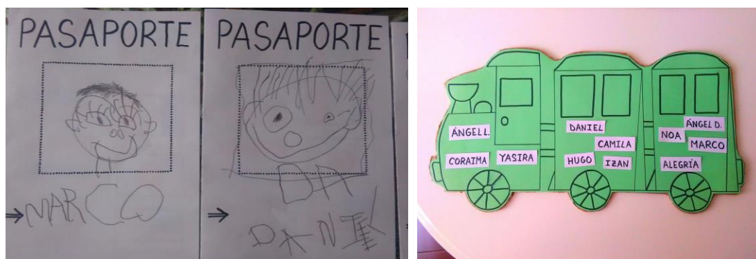
Imágenes del mural del mundo, pasaporte, y medio de transporte realizados para la intervención.