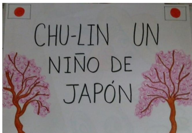
Imagen de la portada realiza para el cuento 4.

En la quinta sesión realizamos una dramatización del cuento en la sala de psicomotricidad.