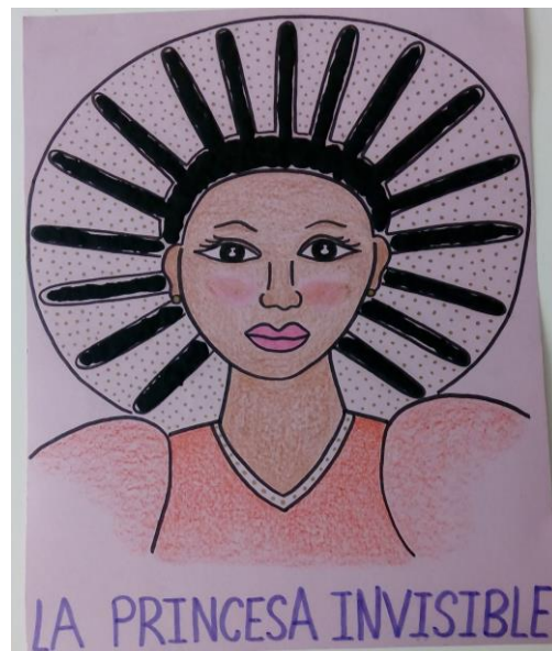
Imágenes de algunas de las actividades realizadas en el cuento 5.