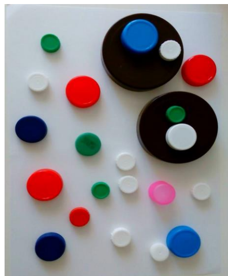
Imágenes de algunas de las manualidades realizadas para el quinto destino.