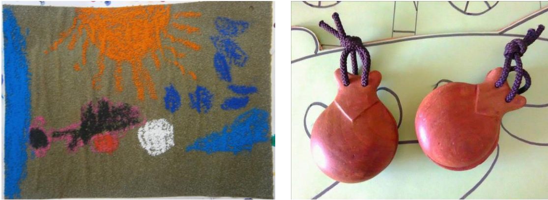
Imágenes de algunas de las actividades realizadas para el séptimo destino.