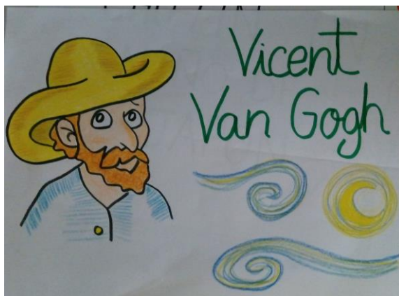
Imagen de la portada realizada para el cuento 3.