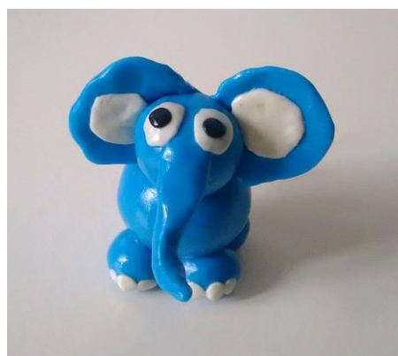
Imágenes de algunas de las actividades realizadas en el cuento 1.