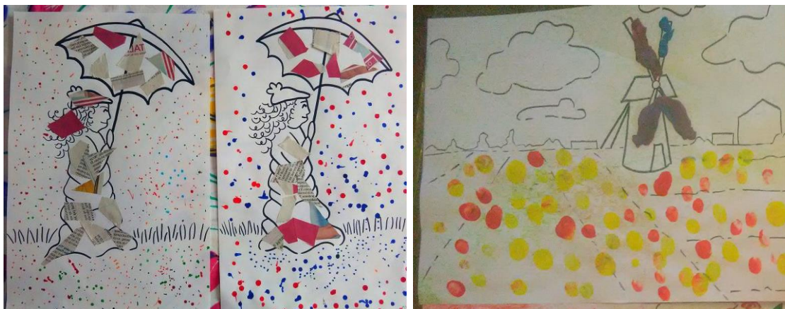
Imágenes de algunas de las manualidades realizadas para el segundo destino.

En la quinta sesión realizamos el cuadro Mujer con sombrilla . Damos a los niños un dibujo del cuadro. Deben hacer puntitos con rotuladores en el fondo, y a la mujer completarla recortando y pegando trozos de papel de periódico.