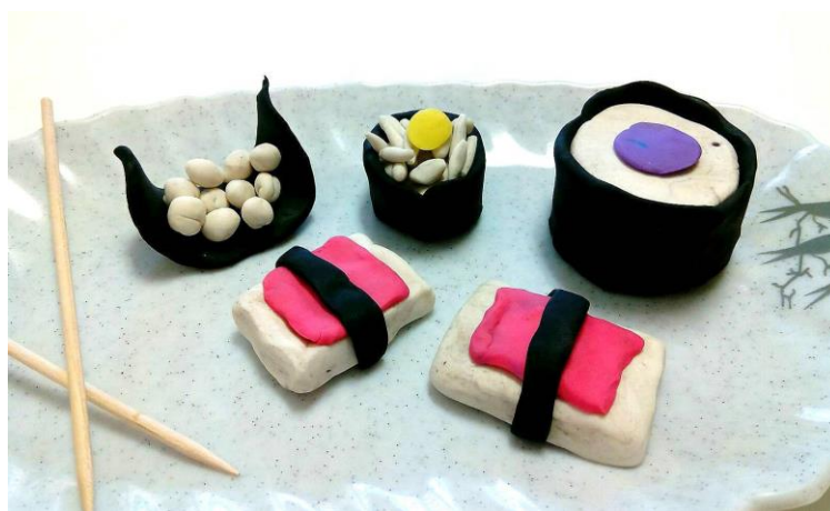
Imágenes de algunas de las manualidades realizadas para el tercer destino.