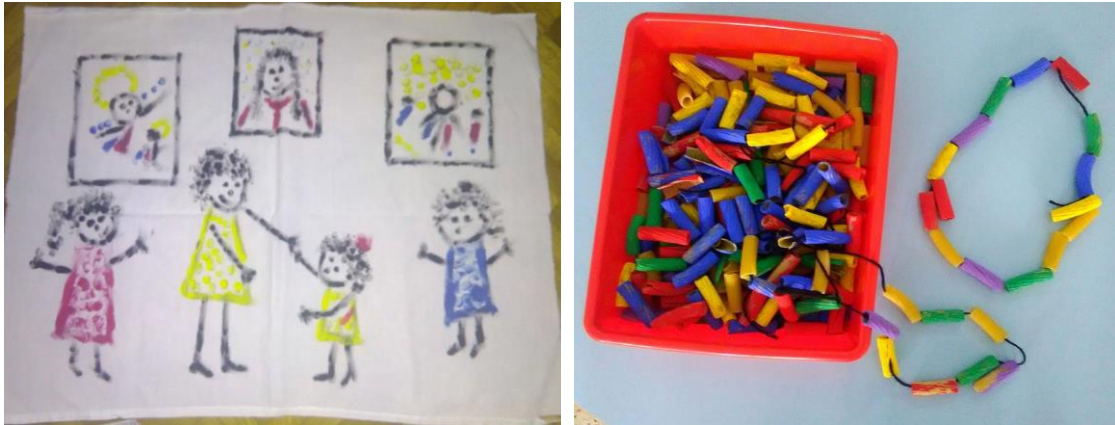
Imágenes de algunas de las manualidades realizadas para el sexto destino.