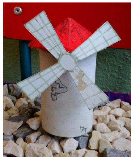
Imágenes de algunas de las manualidades realizadas para el cuarto destino.