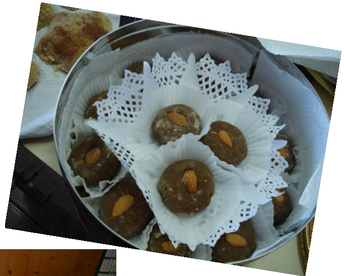
Bolitas de gofio