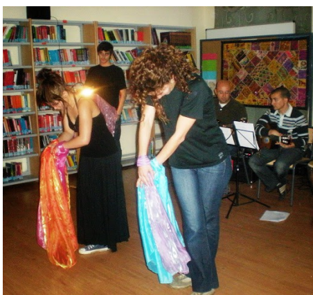
Imágenes del espectáculo sensorial

- Ámbito de actuación: Esta actividad promueve la participación de la comunidad educativa, la creatividad, el respeto hacia las diferentes formas de expresión y la educación social y emocional. Por otro lado, promueve el uso de las nuevas tecnologías y el aprendizaje de lenguas extranjeras o clásicas. Desde un punto de vista didáctico se trabajaron competencias básicas del ámbito de Lengua Castellana y Literatura, Educación Plástica y Visual, Historia del Arte, Música, Inglés, Francés, Portugués, Latín y Griego.