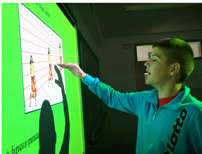
Alumno de 1º de ESO en el taller de Ilusiones ópticas