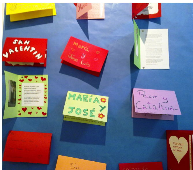
Selección de postales de amor dedicadas a los abuelos.