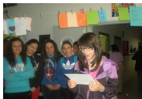
Alumnos de 3º de ESO celebrando el Día Mundial de la Poesía.