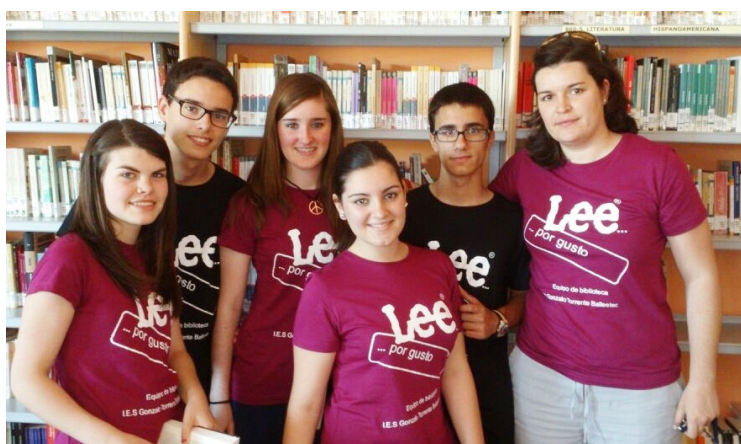
Alumnos y profesora colaboradores de la biblioteca.