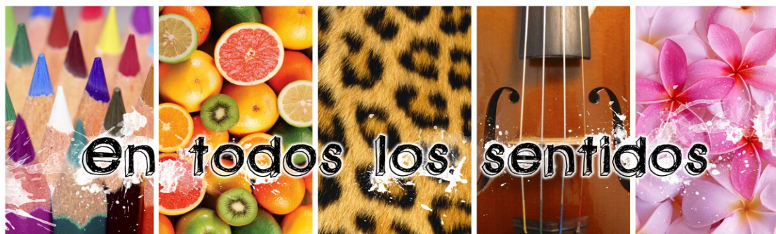
Cartel del proyecto en la entrada de la biblioteca

– Ámbito de actuación: En esta actividad han participado profesores del área de Tecnología , de Educación Plástica y Visual y de Lengua Castellana y Literatura .