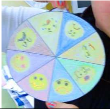
La ruleta de las emociones. Taller de entrenamiento en habilidades.