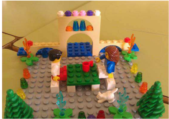
Situación recreada con Lego Story Starter. Taller de entrenamiento en habilidades.