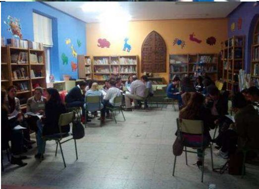
Escuela de familias. Imágenes de los talleres.