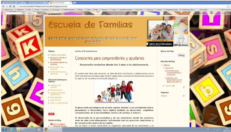
Escuela de familias virtual.

http://www.escueladefamiliasantoniomachado.blogspot.com.es