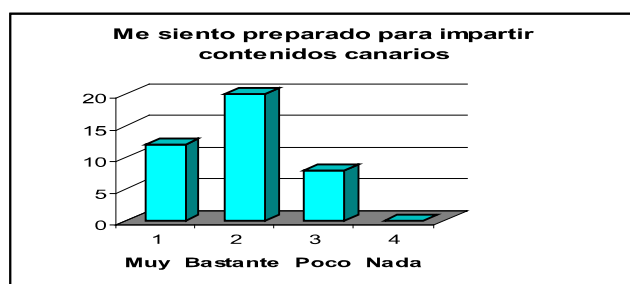
Gráfico 1: Pensamiento del profesorado sobre su capacitación para enseñar las tradiciones canarias en el aula.

Los datos mostrados en el apartado anterior podemos compararlos con las apreciaciones personales de los profesores de Educación Secundaria 7 y sorprende observar como el 47,5 % del profesorado se autopercibe bastante preparado para impartir contenidos canarios tal y como recogemos en el gráfico nº 1; máxime si se tiene en cuenta la formación recibida por el profesorado, que detallamos en el gráfico nº 2.