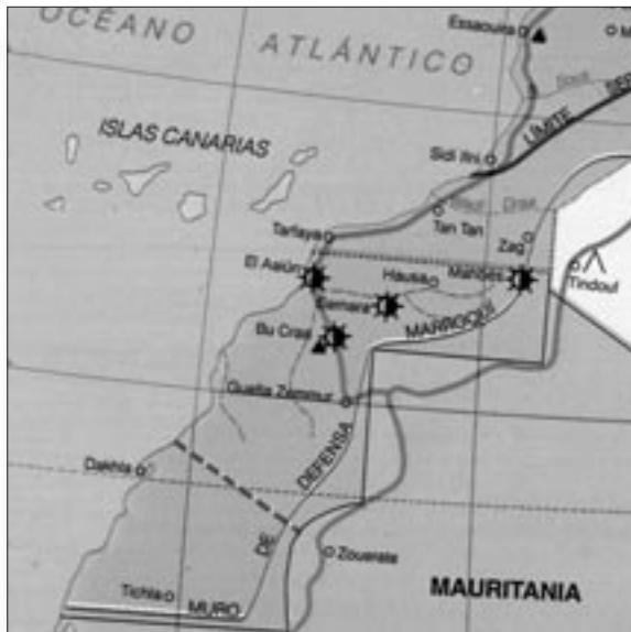
Mapa del conflicte.

Algèria suavitzen les seves posicions, el Polisario mostra novament la seva voluntat de negociar amb Hassan II i al final d'any es produeix una treva. L'Estat Espanyol va manifestar el seu desig de col·laborar tècnicament en la realització del referèndum, ja que l'únic cens fiable és l'espanyol de 1974.