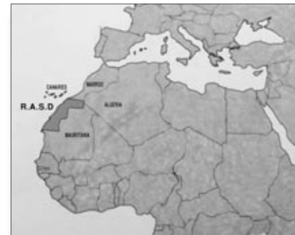
Situació de de la RASD (Republica Arab Saharaui Democràtica) al Continent Africà.

El 1979 Mauritània firma la pau amb la RASD, reconeixent així els drets del poble saharauí i