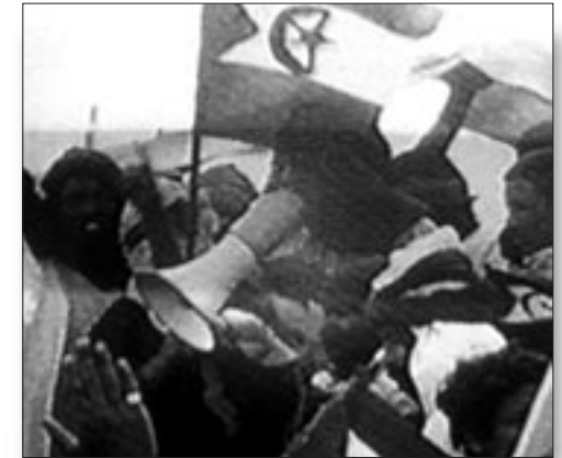
1970. Manifestació al Sàhara Occidental per la independència.

El govern de la dictadura aplica la "Llei de Secrets Oficials" a tot el que fa al Sàhara Occidental.