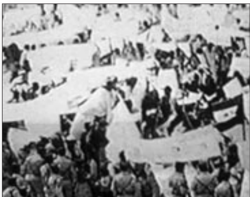
1975. Marxa Verda.