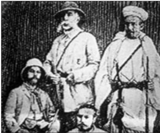
1886. Comerciants espanyols signen amb notables sahrauís l'establiment de factories comercials.

Durant molt de segles, el poble saharauí fou pràcticament desconegut pels europeus. No és pot parlar de presència colonial europea fins a finals del segle XIV i principis del XV, quan portuguesos i espanyols desembarquen a la costa saharauí. La rivalitat entre Portugal i Espanya per la conquesta del territori acaba amb el Tractat de Tordesillas (1494) que atorga el dret de conquesta a Espanya.