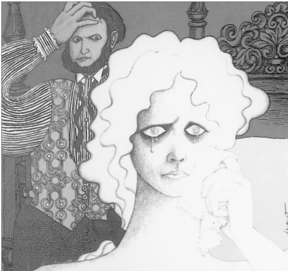
A relación emocional do neno cos seus pais e as relacións mutuas entre os cónxuxes inflúen na conflictividade escolar.

A conflictividade escolar, pois, non se pode comprender sen ter en conta o contexto social. Así Melero Martín (1993) considera factores de violencia escolar: