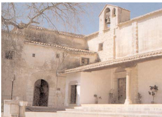
Convent de Sant Bartomeu

En efecte, Inca conté les petjades de les cultures que han anat passant per ella, el Talaiot prehistòric de l'ermita, l'església-oratori del puig cristià de Santa Magdalena, del claustre barroc de Sant Domingo, avui convertit i rehabilitat com a seu d'activitats culturals. Aquests referents són un registre de la memòria de la història i del temps actual de la ciutat.