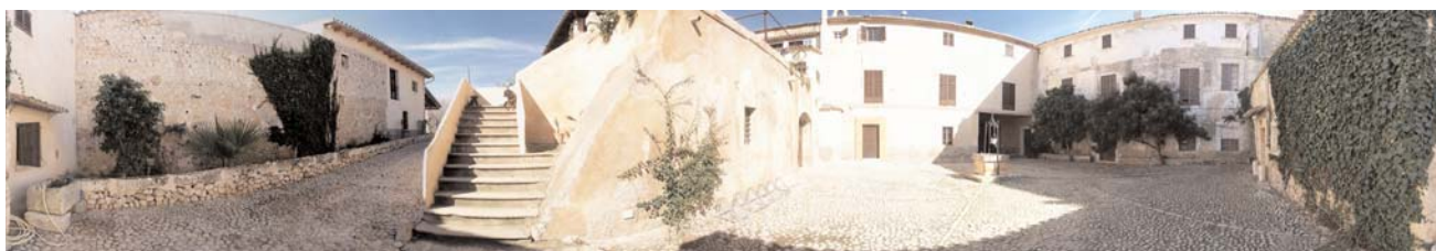
Vista panoràmica de la claustre de Son Vivot

Aquesta mirada pedagògica al patrimoni cultural d'Inca esdevé necessari per a tots els espais