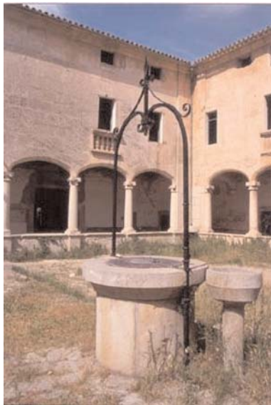
Claustre de Santo Domingo

urbans de Balears com a conformadors d'identitat cultural. Precisament perquè la diferència caracteritza les persones, l'art és una font d'identitat i, amb les ciutats en què es troba immers.