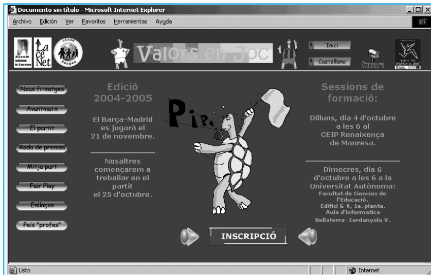
Página principal del proyecto sobre el "Barça-Madrid".

presentan son los mismos alumnos (aunque, evidentemente, el profesorado también puede ser partícipe del proyecto o utilizar en otro contexto los materiales que encontrará). En concreto, está dirigida a niños y niñas que están cursando el ciclo superior de educación primaria y educación secundaria obligatoria (ESO). El hilo conductor del proyecto son los partidos de fútbol que enfrentan al FC Barcelona y al Real Madrid. En este caso, el análisis y la utilización de este fenómeno mediático nos sirve de pretexto para trabajar los valores y, además, representa