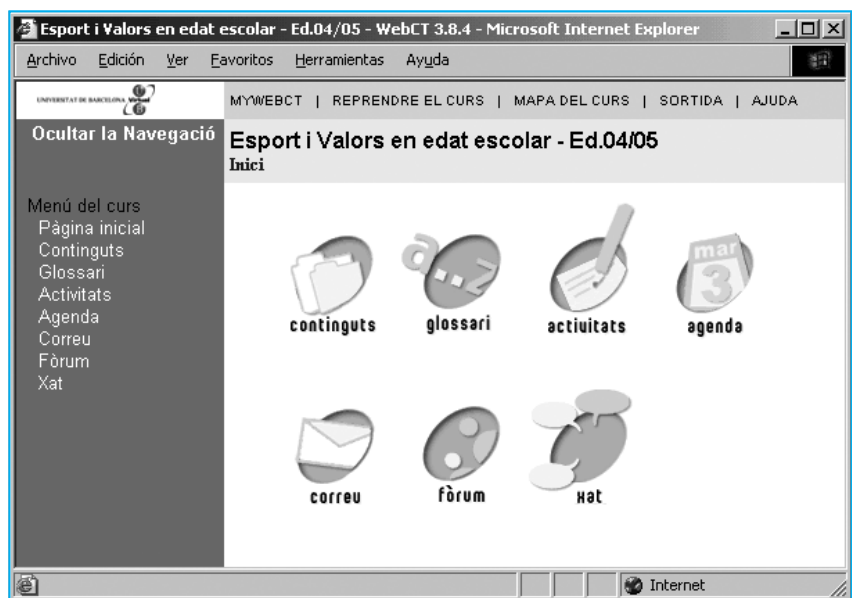
Página principal del curso On Line "Deporte y valores en edad escolar".

Este tercer proyecto es un ejemplo de la utilización de Internet como soporte didáctico. En este caso, también va dirigido a los docentes: en concreto, los destinatarios para los que está pensado son los monitores y monitoras que se hacen cargo del deporte en edad escolar. Asimismo, también puede ser interesante para los árbitros de estas competiciones, para los fa-