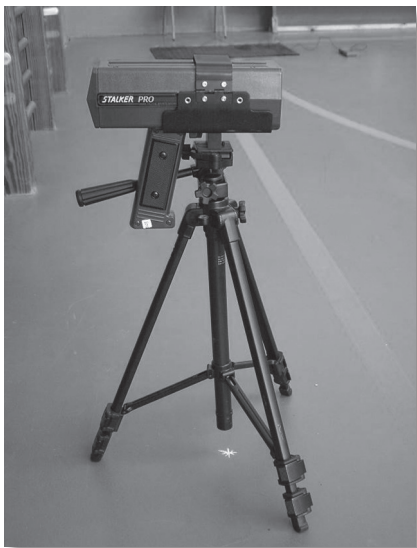
▶ Figura 1 Radar Stalker PRO®.

En fer els mesuraments es va demanar als futbolistes que colpeguessin a diferents velocitats, començant per xuts a velocitat baixa i augmentant la intensitat del colpejament de manera progressiva fins assolir el màxim individual. Tots els colpejaments s'havien de fer amb l'empenya i adreçar-se al radar, que es trobava situat a una distància de 5 m darrere una xarxa per evitar els