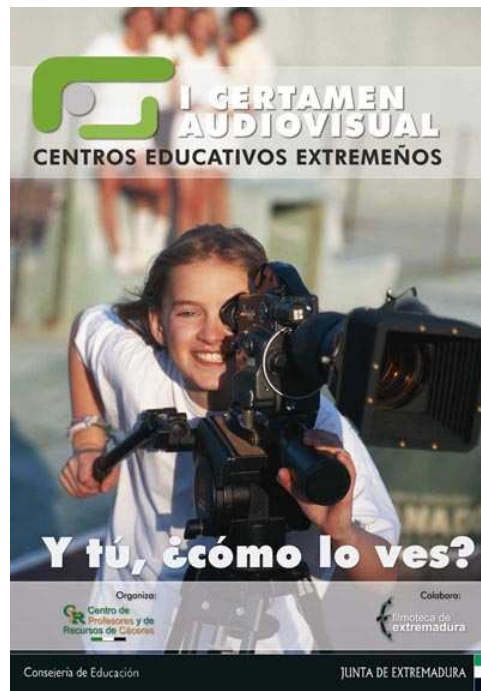
Cartel anunciador del I Certamen Audiovisual