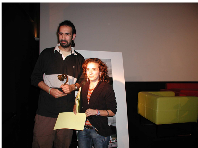
Profesores del Ciclo Formativo del I.E.S. Brocense de Cáceres