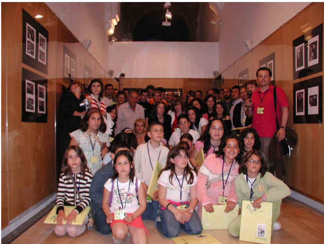
FOTO DE LOS PROFESORES Y ALUMNOS PARTICIPANTES JUNTO CON EL DIPLOMA Y LOS TROFEOS QUE RECIBIERON POR SU PARTICIPACIÓN EN ESTE PRIMER CERTAMEN AUDIOVISUAL DE CENTROS DE EXTREMADURA