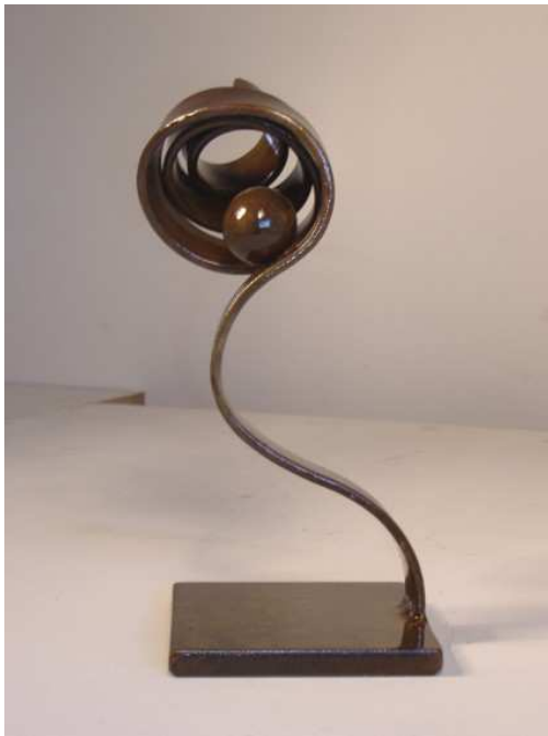
Estatuilla conmemorativa de este primer certamen realizada por César David Montero Montero.