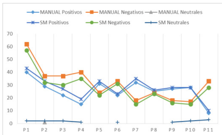
Figura 5. Gráfico de valores predictivos obtenidos en caso de estudio

Fuente: Gutiérrez, 2016 (elaboración propia)