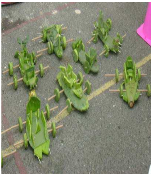
Coches de tuneras