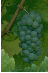
Pie de imagen o gráfico.

Una vez hecha esta pequeña introducción, en mi opinión, bastante motivadora, comenzaremos con la lectura del cuento, no sin antes advertir a los niños que deben estar atentos por si desconocen una palabra para que cuando le demos el turno de palabra la apunten para que cuando le demos el turno de palabra la pregunten. Para facilitar nuestro trabajo adjunto un pequeño glosario que recoge los conceptos que están más vinculados con la cultura de la tierra y que aparecen en la lectura.