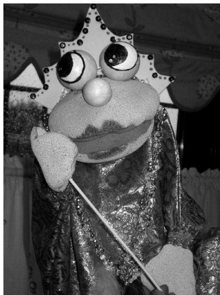
Distribución de roles: la princesa (la bondad), la bruja (la maldad), el rey (la justicia).

caso de que sea el alumnado particularmente quien lo manipula, el docente debe dar oportunidad a la improvisación como medio de descarga de sus propias emociones y para el desarrollo de su proceso creativo.