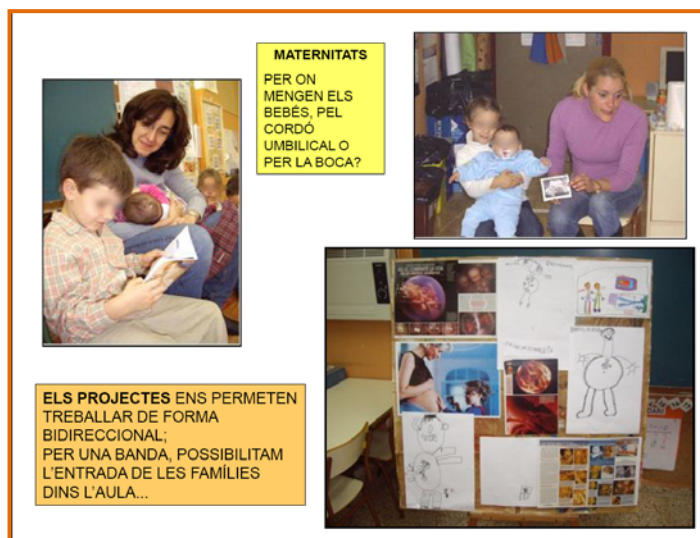
Figura 2. Captura de pantalla del recurs "Infants, Escola i Família...".

El resultat d'haver compartit amb les famílies la nostra manera de funcionar fa que s'adonin que tenen cabuda dins l'aula totes les experiències aportades per qualsevol infant del grup.