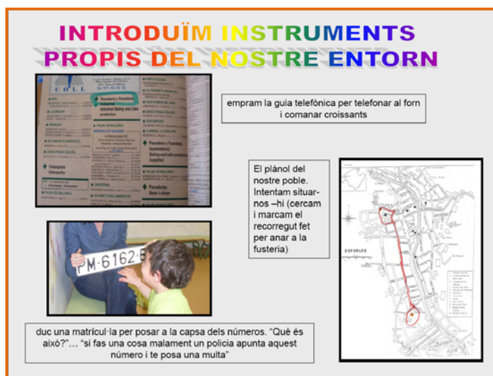
Figura 7. Captura de pantalla del recurs "La mestra de suport i les matemàtiques".

Us presentem una altra forma d'enfocar l'aprenentatge de les matemàtiques dins les aules, motivat per la necessitat d'orientar les mestres-tutores en aquesta nova manera de fer.