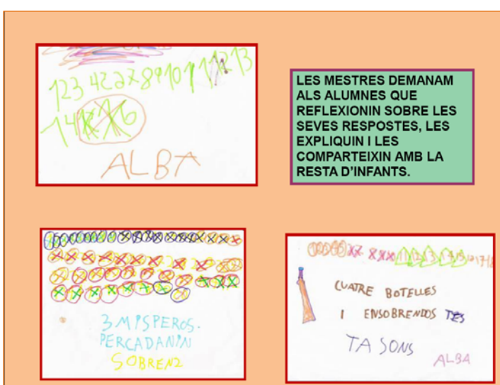
Figura 1. Captura de pantalla del recurs "Conviure per aprendre".