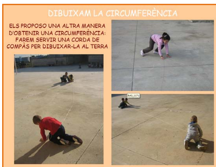
Figura 4. Captura de pantalla del recurs "L'ensaïmada gegant".

La història sorgeix a partir d'una notícia d'un diari, que ha duit la mestra, que explica que a Inca feren l'ensaïmada més grossa del món, de 12 metres de diàmetre. L'objectiu de la mestra era aconseguir que els infants compreguessin aquesta notícia, com devia ser una ensaïmada d'aquestes dimensions.