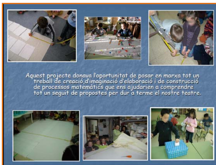
Figura 5. Captura de pantalla del recurs "Teatre d'ombres".

Aquesta experiència va néixer de la necessitat que tenia un grup d'infants d'expressar i compartir amb els altres les seves emocions i més que cap LA POR. Durant un parell de setmanes va ser un tema que sempre sortia a primera hora del dematí durant l'assemblea, per aquest motiu els vaig portar un conte : DE QUÈ TÉ POR EL RATOLÍ?, amb la intenció d'aprofundir més en aquesta emoció. La meua sorpresa va ser adonar-me a mesura que anàvem avançant que els infants no tenien cap interès a treballar aquest tema, sinó que allò que volien fer era jugar amb les seves pors. A vegades els nostres interessos i els dels infants no van pel mateix