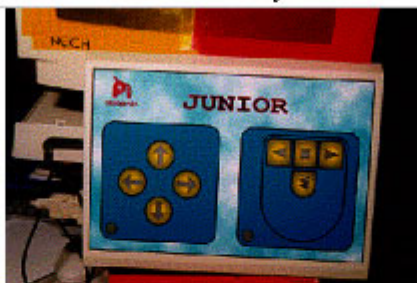
Emulador de ratón para usuarios gravemente afectados. Se acciona mediante un interruptor adaptado a sus posibilidades