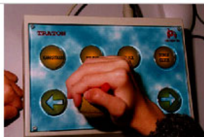
Emulador de ratón para usuarios que pueden pulsar los botones, directamente o con la ayuda de un pulsador