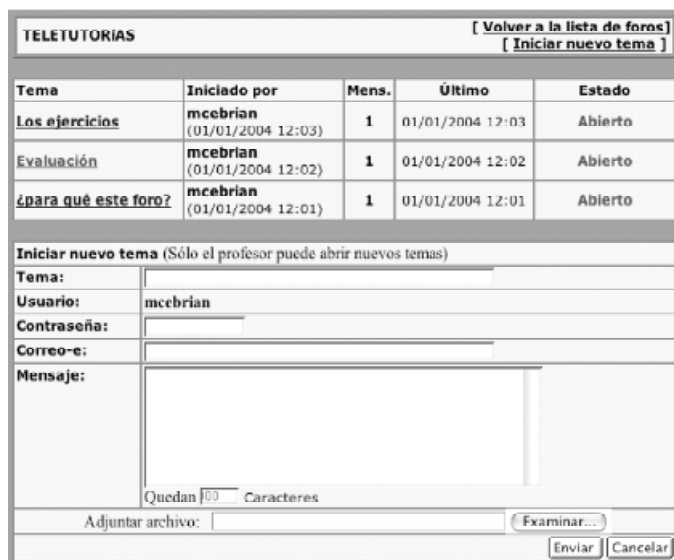
Imagen 2. Pantalla vista por los estudiantes.

señalaremos los tres espacios fundamentales que albergan foros (que resaltaremos en negrita), como puede verse en la imagen 3: