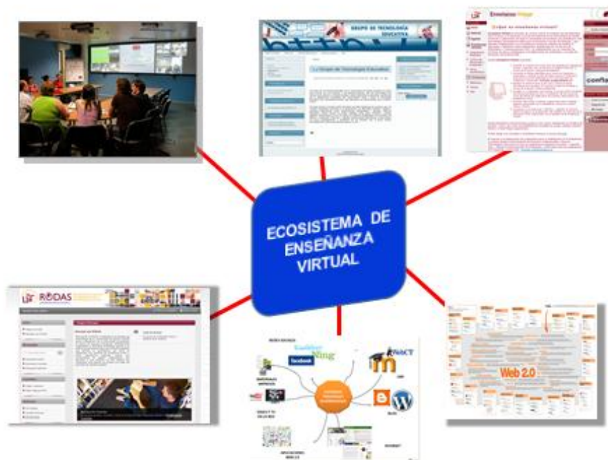
Fig. nº 2. Ecosistema de formación virtual.