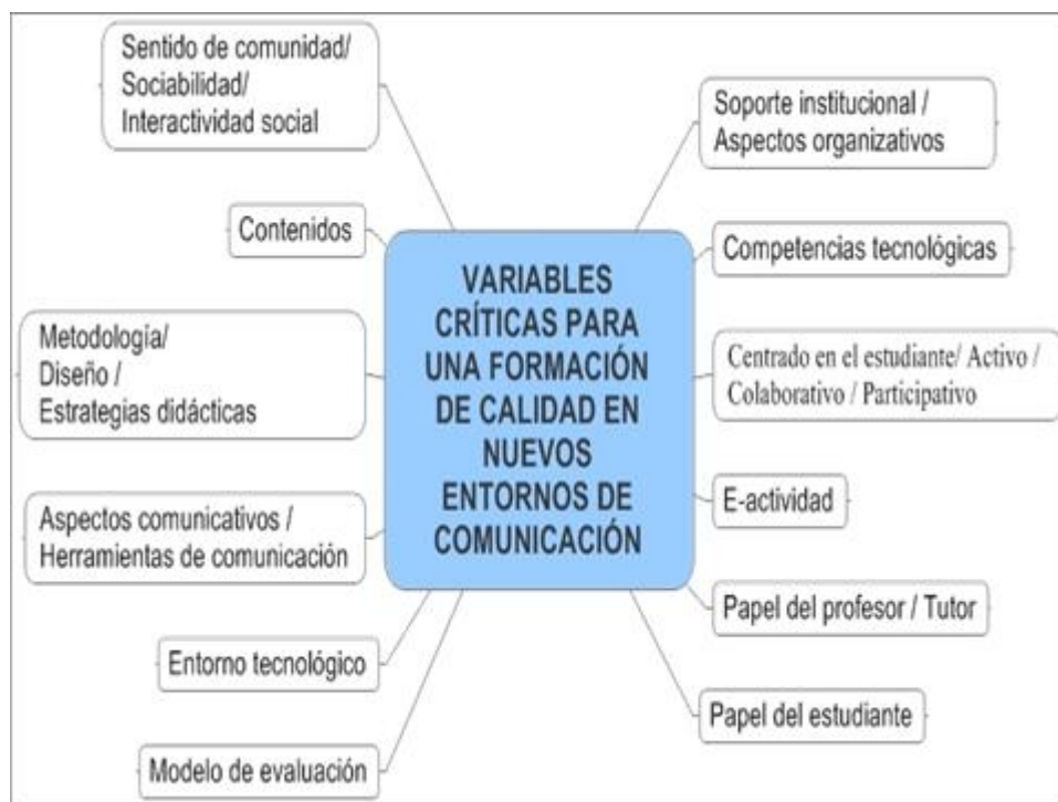
Fig. nº 1.- Variables críticas para una formación de calidad en los nuevos escenarios de comunicación (Cabero, 2006).

garantizarían (Cabero, 2006) hacer acciones formativas de calidad en el e-learning (fig. nº 1), y que nos habíamos centrado demasiado en los componentes meramente tecnológicos e instrumentales, y en el tipo de plataforma a utilizar.