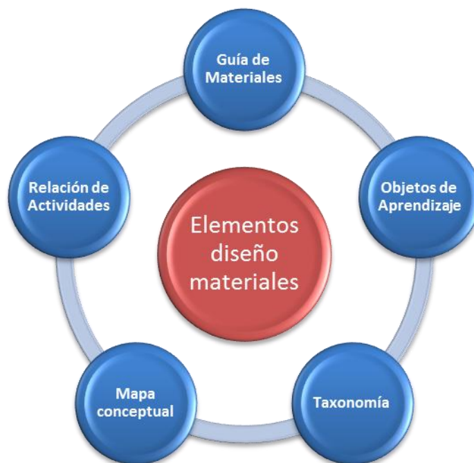
Fig. nº 3.- Elementos utilizados para el diseño de los materiales.

Digamos desde el principio que para el diseño de materiales hemos contemplado diferentes tipos de elementos: guía de materiales, objetos de aprendizaje, taxonomía, mapa conceptual, y relación de actividades (fig. nº 3), y que son similares para las 14 unidades que componen la experiencia, y que presentaremos posteriormente.