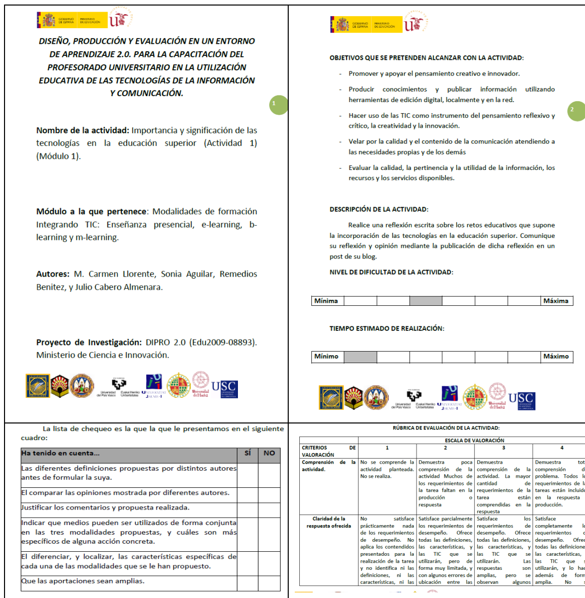
Fig. nº 9.- Elementos que se incorporan en cada una de las actividades.

El número de tareas y actividades que se ofrecen en cada una de las unidades, las presentamos en la tabla nº 4.