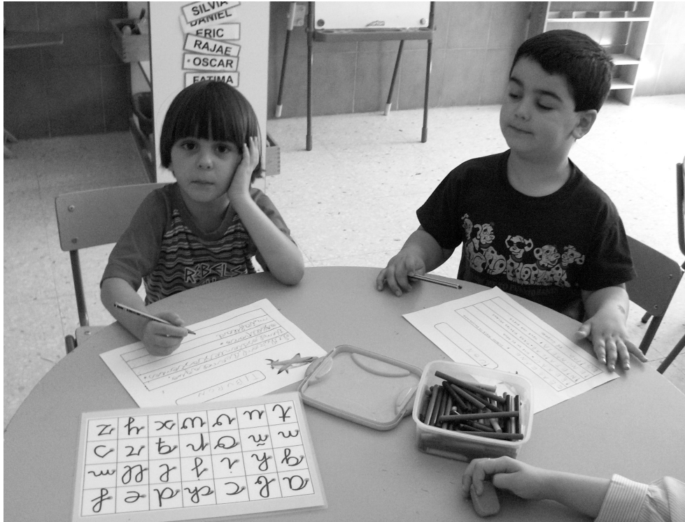
Es un método de lecto-escritura más adaptado a las características del alumnado.

electoral, creamos dos partidos políticos, hicimos el censo electoral, un carné de identidad (para poder votar), los banderines, los carteles, (los pegamos en el colegio) las papeletas, los programas electorales, y por último, aprovechando las urnas y la cabina de las elecciones que trajeron al colegio, hicimos las votaciones.