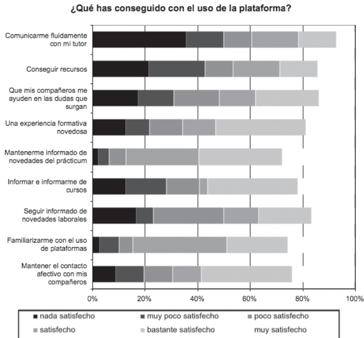
Gráfico 1. Expectativas sobre el uso de la plataforma Gráfico 2. Satisfacción con el uso de la plataforma

Objetivo 2. Indagar en la relación que la capacitación tecnológica de los estudiantes ha tenido sobre el desarrollo de la comunidad de aprendizaje en dos de sus dimensiones que la definen: presencia social y presencia cognitiva.