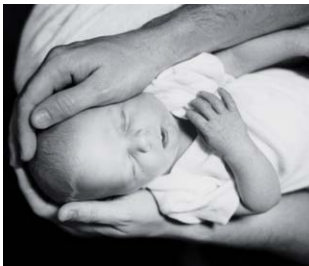
También los padres pueden quedarse en casa para cuidar a los niños.

El Estado de Finlandia invierte mucho en educación. El apoyo económico del Estado y de los municipios a las escuelas es muy importante y posibilita contratar a una gran cantidad de personal de apoyo en las mismas. Si un alumno presenta algún tipo de dificultad para aprender, es posible disponer de los recursos de apoyo y de la ayuda necesaria en función del tipo de problema que presente. La preocupación principal es detectar los problemas cuanto antes