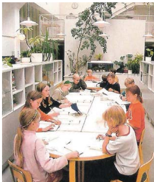
Los alumnos aprenden trabajar en grupos.

El éxito escolar finlandés ha suscitado un interés mundial, no obstante, la causa del éxito escolar en Finlandia no es el resultado de un elemento aislado, sino la suma de una multiplicidad de variables.