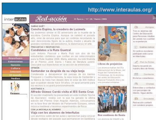
Ejemplo de web para utilizar con un método por proyectos.