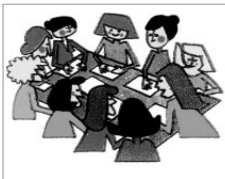
Unha estratexia importante é a axuda entre compañeiros.

Outra importante estratexia cooperativa é a axuda entre compañeiros, ou a titoría entre iguais que teñen unhas vantaxes prácticas e pedagóxicas ben coñecidas polos mestres das aldeas e pequenos núcleos de poboación (escolas unitarias e centros rurais agrupados). A necesidade de atender a alumnos de diferentes idades e capacidades por parte dun mesmo mestre converte os alumnos avanzados en instructores dos máis pequenos ou que aínda non dominan determinada aprendizaxe. Isto libera o mestre para atender a outras tarefas, observar e orienta-lo traballo dos alumnos, ou apoiar directamente a un alumno ou grupo determinado. Desde a corrente cognitivista postulouse as vantaxes da axuda mutua, tanto por razóns motivacionais, como comunicativas e psicolóxicas. Benefíciase tanto o que é axudado por outro compañeiro, como o que axuda, xa que este consolida e refina o seu coñecemento ó ter que ensinar a outro, ó tempo que reforza a súa autoestima. Ademais desenvolve a interdependencia e o sentido de axuda. Debe estar planificada polo profesor, que lles dá instrucións ós alumnos que han de facer de titores e coida de que todos teñan a oportunidade de intercambia-los papeis.