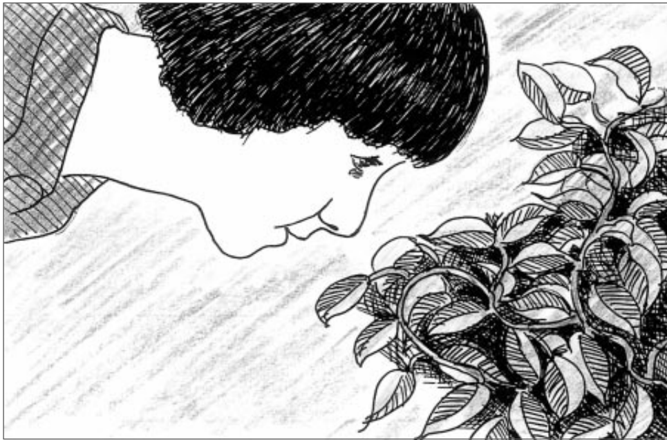
Algunhas persoas con discapacidade mostran unha gran necesidade de comunicación.

esquemas máis globais que alcancen a todo o centro. Moi sinteticamente, estes programas deben abranguelos seguintes ámbitos: