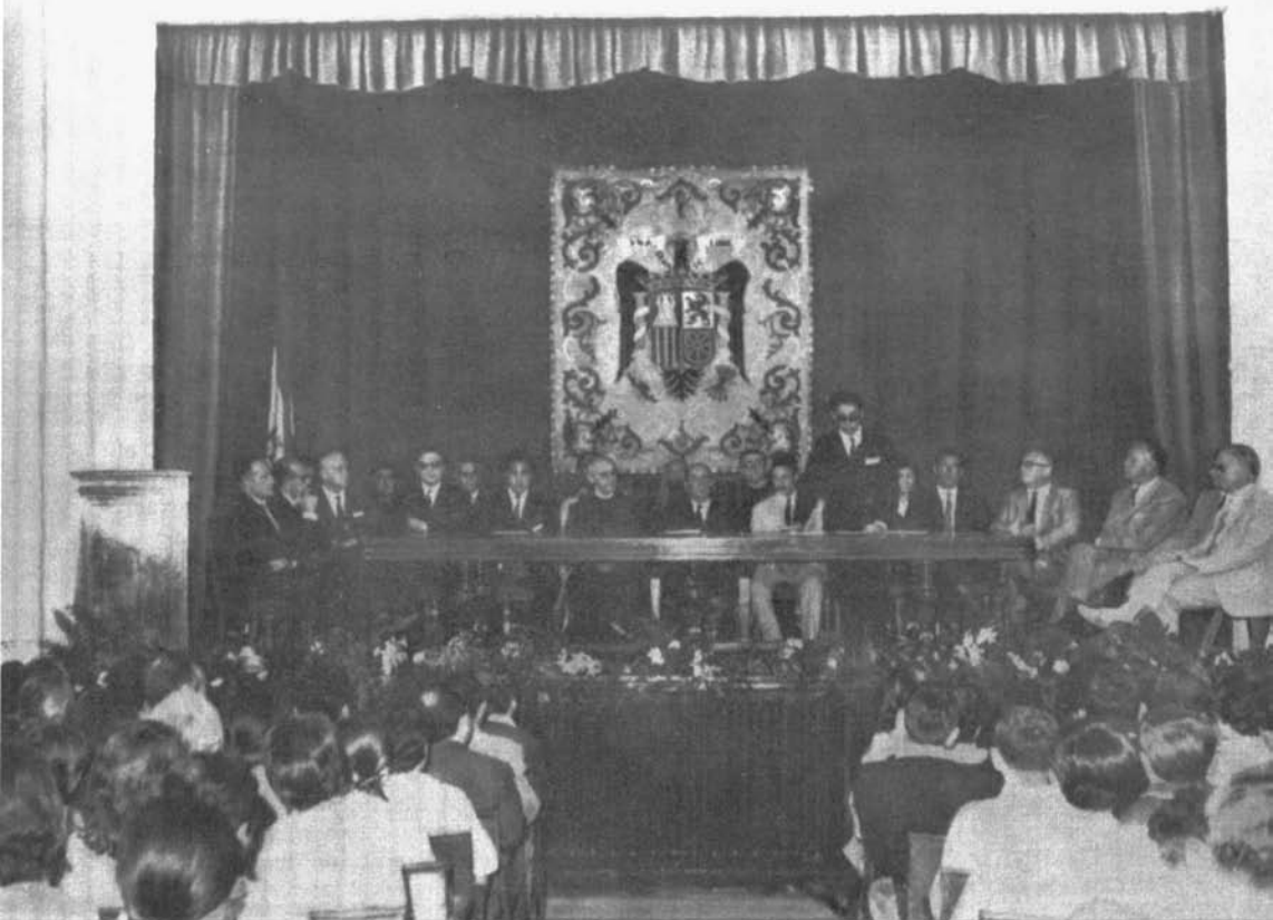
Instituto de Tánger: inauguración de curso