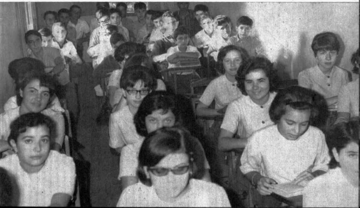
Alumnos y alumnas del tercer curso.