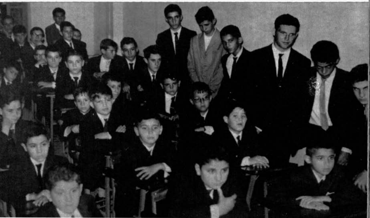
Grupo de alumnos en el acto inaugural de las tareas académicas del curso 1965-66.