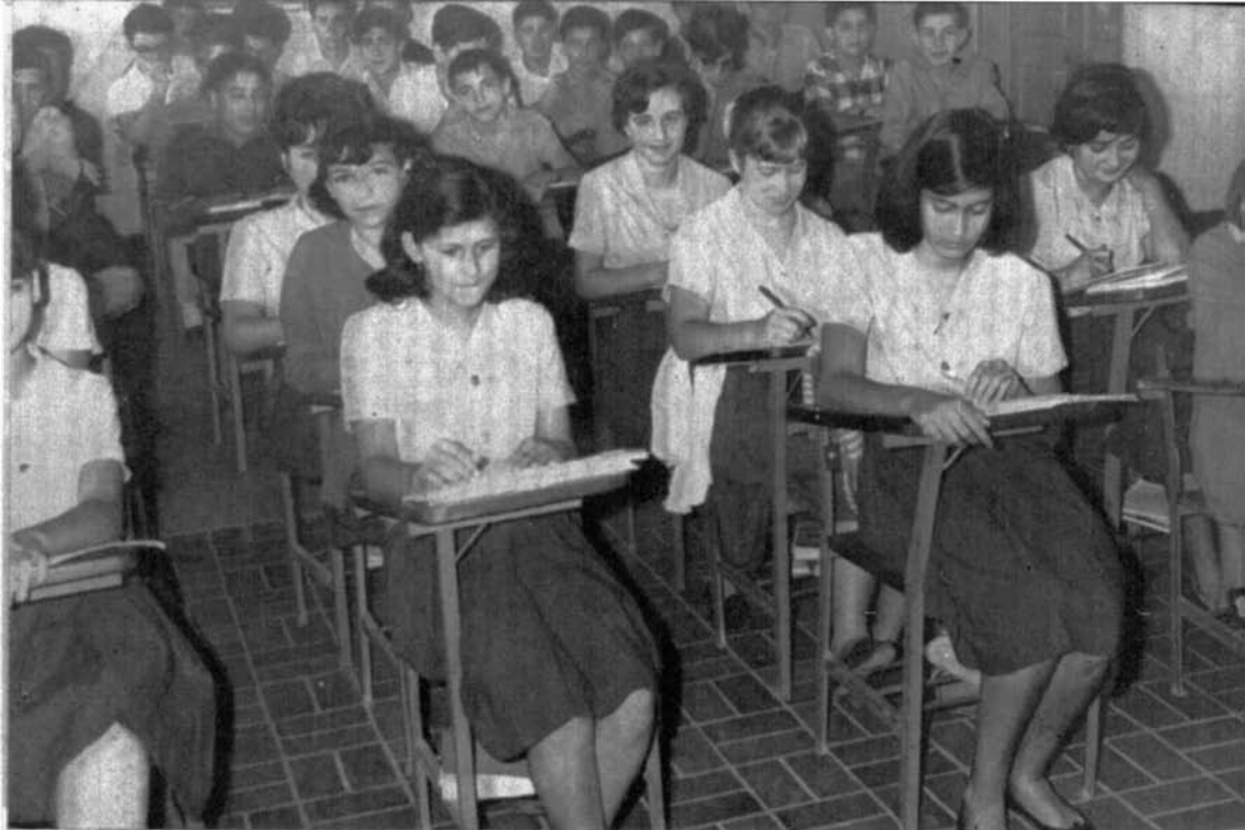
Alumnos de cuarto curso.