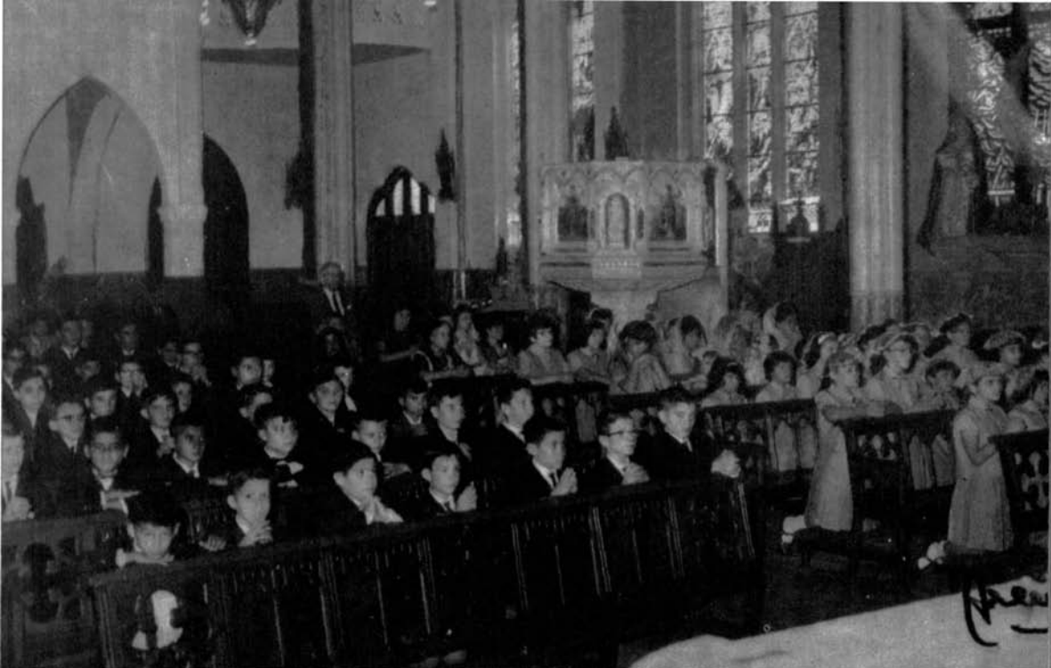
Misa del Espíritu Santo, en la Iglesia del Sagrado Corazón, en la inauguración de curso.