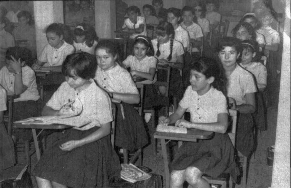
Alumnos y alumnas del primer curso del Colegio "Diego de Losada".