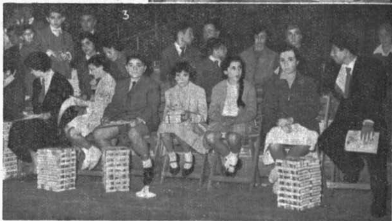
3. Varios de los alumnos premiados, con los lotes de libros que recibieron por sus trabajos literarios.