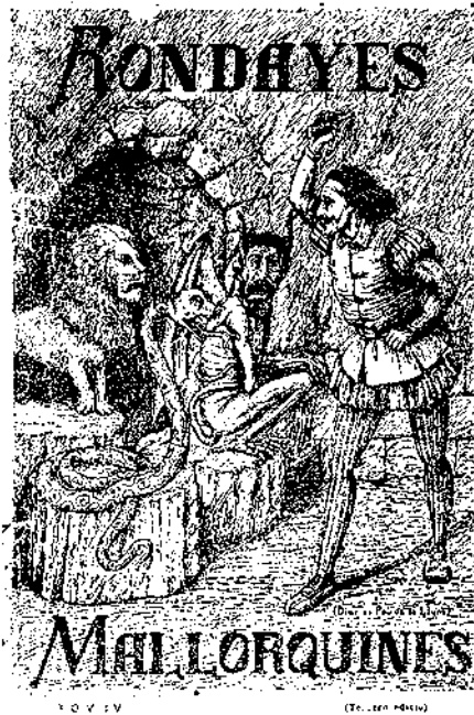
Coberta de la tercera edició del Tom IV de Rondalles Mallorquines , amb una il·lustració de Francesc de B. Moll per a la rondalla Es pou de sa lluna

El cas de l'àrea lingüística —de les àrees lingüístiques— és un dels més apassionants, també dels més difícils i delicats per raons de la diversitat de criteris amb què pot ser enfocada. Però, endemés de la llengua, són múltiples els àmbits curriculars on la literatura de tradició oral pot presentar una incidència instrumental, considerable en alguns dels camps, episòdica en d'altres. Així, per exemple, en tot allò que fa referència al medi —social, natural, cultural— les possibilitats són enormes: el lligam amb la història són les tradicions —romancer, cançoner, llegendari, narrativa, etc.—; la vinculació amb la geografia i les ciències naturals pot entendre's en el sentit que elements diversos de la terra, del cel, de la natura —astres, estrelles, accidents geogràfics, animals, plantes, etc.— són sovint punt de referència o objecte de tractament d'etnotextos —mites, llegendes, cançons, refranys, endevinalles; costums, gastronomia, creences, medicina popular, etc.—; el descobrimient del cos i l' educació física poden veure's estalonats amb l'ús de cançons, d'endevinalles, de jocs