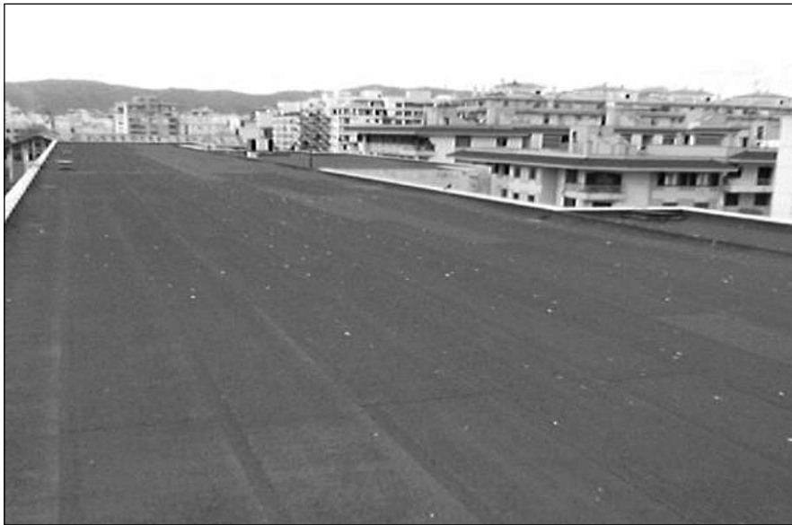
Immens terrat de l'IES Josep M a Llopart. Les possibilitats d'instal·lació i d'orientació de plaques fotovoltaïques, com es pot comprovar, són immillorables en aquest centre. El mateix passa a la majoria de centres educatius de les illes.

centres a on es trobin situades les plaques i, fins i tot, pels d'altres centres organitzant un sistema de visites i qualche tipus de material didàctic, com ja es fa actualment a l'institut de Lluçmajor (vegeu la pàgina web del SACE: HIPERVÍNCULO " http://web.caib.es/Programes/ambientalitzacio/Activitats/Act11/Act11-02.htm " " http://web.caib.es/Programes/ambientalitzacio/Activitats/Act11/Act11-02.htm ").