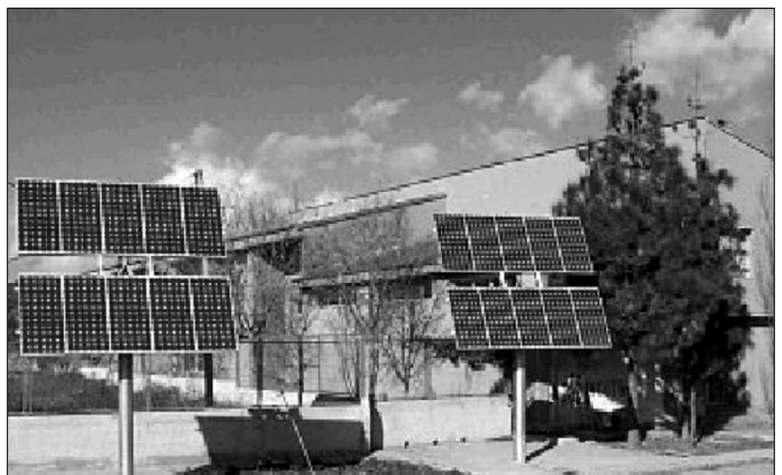
Instal·lacions fotovoltaïques a l'IES Lluçmajor. Des de es varen instal·lar, aquestes plaques han contribuït a l'estalvi de 10.150 kg de CO 2 i a la producció de 8.461 kWh. D'altra banda, són una eina didàctica de primera magnitud, tant per als alumnes del propi centre, com per als d'altres escoles i instituts que poden visitar la instal·lació. (HIPERVÍNCULO " http://web.caib.es/Programes/ambientalitzacio/DOCUMENTS/Act11-02-2.pdf " " http://web.caib.es/Programes/ambientalitzacio/DOCUMENTS/Act11-02-2.pdf ").

A més a més a les Balears comptam amb un alt nombre d'hores de sol anuals (236 dies de sol a l'any !!) per la qual cosa el rendiment d'aquestes instal·lacions seria encara més gran.