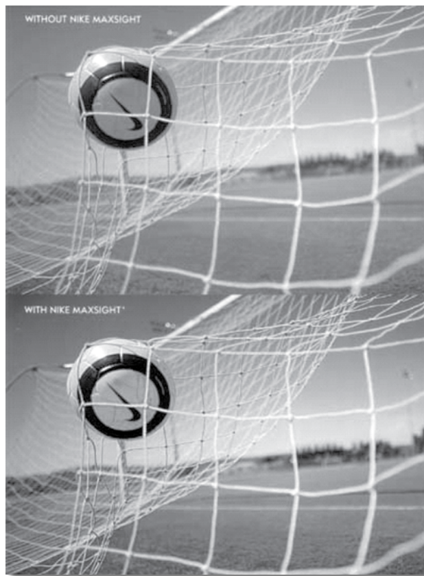
Tinte ámbar: arriba sin y abajo con lente de contacto Nike Maxsight.

Estas lentes de contacto se fabrican con dos posibles tintes (ámbar y gris-verdoso) que evitan el deslumbramiento. La óptica denominada " Light Architecture " filtra de forma selectiva longitudes de onda concretas para mejorar los contrastes y reducir la incomodidad y el cansancio asociados al deslumbramiento tan común en deportes practicados al aire libre. Esto es importante porque, sin duda, destacar un elemento de crucial interés en el deporte como es la pelota ayuda a potenciar el rendimiento deportivo. Además, elimina más del 95 % de los rayos UVA y UVB. Esta característica resulta sumamente interesante si consideramos los efectos nocivos de la radiación ultravioleta, potenciados por la disminución de la capa de ozono, que en los próximos años, se calcula que causará que alrededor del 33 % de la población de entre 45 y 65 años desarrolle cataratas tempranas (Karpecki, 2006). Por último, también se han fabricado para eliminar más del 90 % de la luz azul, muy relacionada con la fatiga visual (Reichow 2005).