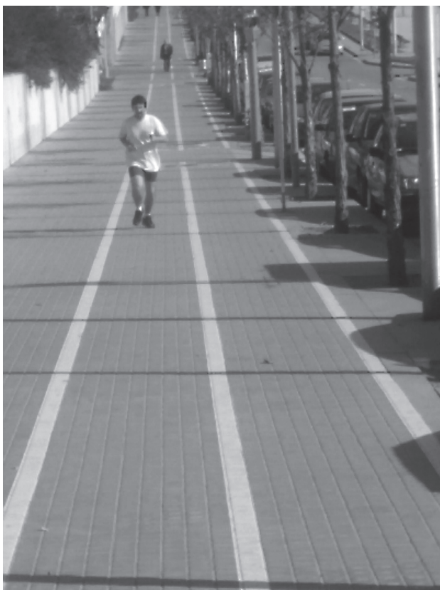
Corredor. La realitat dels espais delimitats per a un determinat tipus de pràctica, no sempre es correspon amb el seu plantejament teòric. Exemple: carril bici de la Ronda Litoral.

entrevistes es desprèn que es reconeixen de caminar per la zona i que mantenen xerrades i fins i tot caminen junts si es troben i els ve de gust, però que han intimat amb pocs o cap d'ells. Contràriament, a la mateixa zona també trobem un altre grup similar –coneguts entre ells de caminar per la mateixa zona– que ens va informar que tenien un dia i un lloc de trobada predeterminat, malgrat que no havien formalitzat mai aquesta relació i no se sentien obligats a mantenir-la: el costum s'ha fet norma.