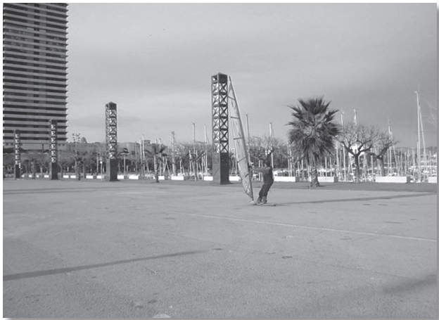
La gran diversitat de pràctiques esportives que han fet el salt des dels equipaments esportius fins al carrer inclou també hibridacions com és el cas del “windskite” (un “skate long” amb una vela de “windsurf” acoblada).

alguns elements postmaterialistes, combinats amb valors moderns que val la pena tenir en compte (García, 2006): la salut, la distracció i el lleure. Per exemple, hem observat que, en aquelles pràctiques de desplaçament amb poca dificultat tècnica com ara el “jòguing”, caminar o el ciclisme, predominen usuaris que busquen un rèdit de les pràctiques esmentades traduït en objectius de salut i benestar. D'altra banda, aquelles activitats de lliscament que requereixen un nivell tècnic més elevat (el patinatge, el “skate”, el “windskite”...) són practicades majoritàriament amb els objectius de diversió i lleure. En aquest segon cas cal no oblidar que, especialment en els col·lectius de més edat (d'entre 30 i 40 anys), la competició amb un mateix i amb els altres i fins i tot la possibilitat de professionalització, hi pot jugar un paper important.