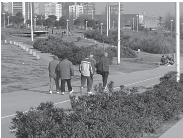
Caminadors del Passeig Marítim que es troben en la Barceloneta per anar junts és un exemple de relació sense compromís formal que perdura al llarg del temps.