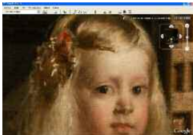
Las Meninas, Diego Velázquez.