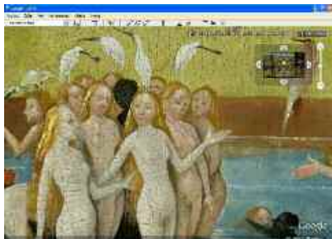
El jardín de las Delicias, El Bosco.

detalles de la vestimenta, del cuerpo o del paisaje. Para facilitar esta actitud investigadora sería deseable que el programa habilitara la posibilidad –en la actualidad inviable– de guardar digitalmente fragmentos seleccionados.