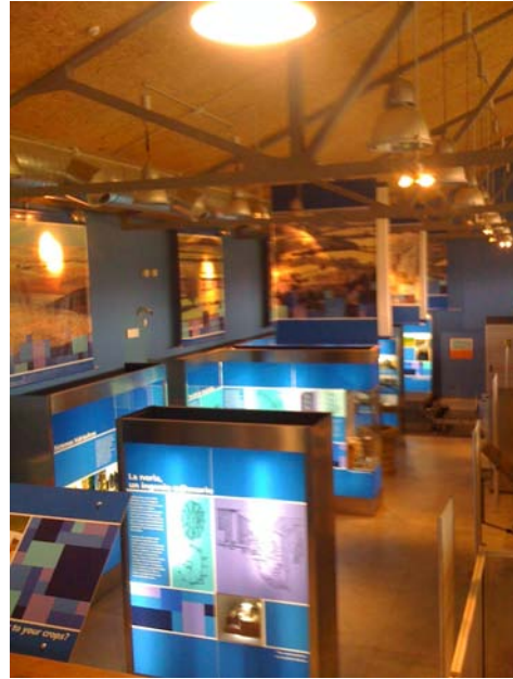
ALGUNAS ACTIVIDADES EN EL CIAR