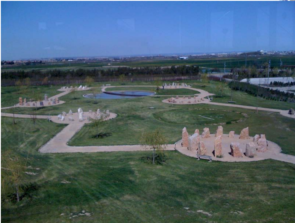
PANORÁMICA DEL ENTORNO NATURAL