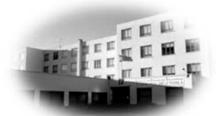
Instituto de Educación Secundaria "Hermanos Argensola"